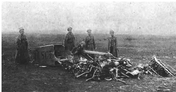
Германский аэропланъ, сбитый нашей артиллеріей у посада Щенанково, Ломжинской губ.

охладить чрезъчуръ возбужденное настроеніе умовъ населенія. Руководящіе круги страны предостерегаютъ послѣднюю отъ слишкомъ преувеличенныхъ надеждъ и категорически запрещаютъ обсуждать условія мира, заключеніе котораго, увѣе, зависить далеко не отъ нихъ.