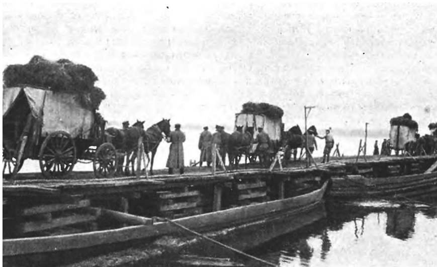
У Двины. На понтонномъ мосту

въ этотъ вечеръ. Эта лестная задача всецѣло соответствуетъ моимъ личнымъ чувствамъ, и я выполняю ее съ особеннымъ удовольствіемъ. Добро пожаловать вамъ, господа, представителямъ французскаго правительства и прекрасной и благородной Франціи, съ коей насъ связываютъ столь прочныя узы дружбы, восхищенія и общности интересовъ передъ ужаснымъ испытаніемъ, которому насъ подвергаетъ безчестный и безсовѣстный врагъ, движимый такою гордостью и жадной владѣчества, какихъ до сихъ поръ свѣтъ не видѣлъ.