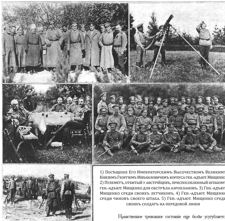
1) Посещение Его Императорским Высочеством Великим Княземъ Георгиемъ Михайловичемъ корпуса ген.-адъют. Мищенко. 2) Пулеметъ, отбитый у австрійцевъ, приспособленный штабомъ ген.-адъют. Мищенко для обстрѣла аэроплановъ. 3) Ген.-адъют. Мищенко среди своихъ летчиковъ. 4) Ген.-адъют. Мищенко среди чиновъ своего штаба. 5) Ген.-адъют. Мищенко среди своихъ солдатъ на передовой линіи

въ видѣ безчисленныхъ потерь и истощенія нанудшихъ силъ арміи, не можетъ безъ конца поддерживать иллюзіи. Германія должна, наконецъ, замѣтить угрожающіе ей симптомы истощенія.