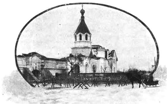
Церковь въ м. Постава, сожженная нѣмцами передъ занятіемъ мѣстечка 85-мъ пѣхотнымъ Выборгскимъ полкомъ

Война состоитъ изъ трехъ дѣйствій: расположеній, маршей и битвъ. Большинство войнъ рѣшилось битвами,