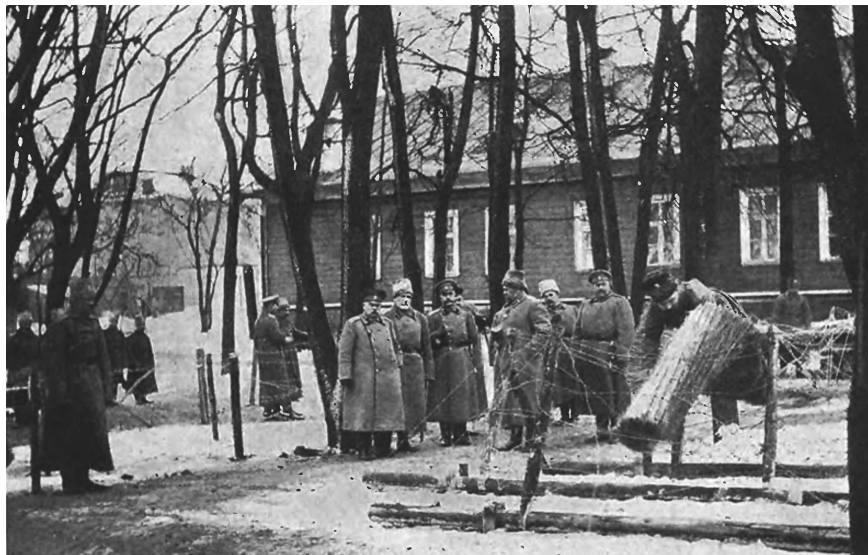
Опыты по преодолению проволочных заграждений в присутствии главнокомандующего западным фронтом

недѣль бывший германскій министр внутренних дѣлъ заявилъ о неподготовленности Германіи въ продовольственномъ отношеніи къ продолжительной войнѣ. И какъ бы еще ни были нѣмцы сильны боевыми силами, которыя, быть можетъ, еще далеки отъ истощенія, питательныя ихъ силы не могутъ постоянно пополняться въ размѣрахъ, потребныхъ для арміи и населенія, все уже чаще и чаще бунтующаго, несмотря на энергичное подавленіе проявленій голода полицейскими мѣрами.