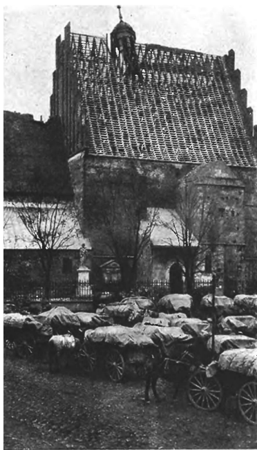
Близъ Вилейки. Ночевка транспорта

Въ теченіе долгаго времени и германскій народъ, и армія твердо вѣрили въ побѣду, и именно въ такую побѣду, какой они жаждали: полный разгромъ союзниковъ. Рядъ стратегическихъ успѣховъ, раздутыхъ правительствомъ и прессою въ грандіозныя побѣды, а также преимущества организаціи, мобилизовавшей всѣ наличныя силы страны, поддерживали въ населеніи сознаніе неоспоримаго превосходства Германіи. Наши враги вполне чистосердечно считали себя непобѣдимыми. Только цѣлый рядъ лишеній, мириться съ которыми, рано или поздно, становится, наконецъ, не подъ силу, страхъ передъ затянувшейся войной и смущеніе передъ безповоротнымъ рѣшеніемъ союзниковъ довести борьбу до конца, мало-по-малу поколебали эту слѣпую вѣру въ самихъ себя, являющуюся выразителемъ нравственнаго состоянія страны. Въ настоящее время Германія напрягаетъ всѣ силы, идетъ на какой угодно рискъ, лишь бы только не быть