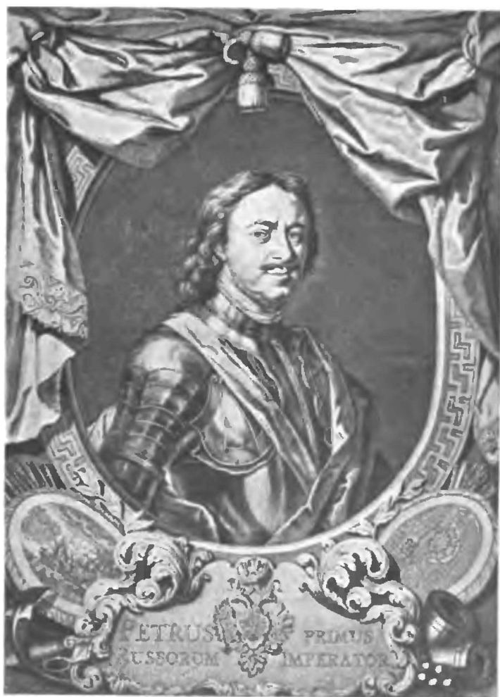
Императоръ Петръ I.