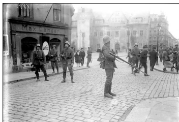
Войска рейхсвера противостоят немецким коммунистам

Однако такая оценка, хотя бы и полусознательная, представляется глубоко ошибочной, да к тому же еще и национально ограниченной. Если нам не предстоит более повторять опыт Октябрьской революции, то это вовсе не значит, что нам нечему учиться на этом опыте. Мы — часть Интернационала, а пролетариат всех других стран только еще стоит перед разрешением своей «октябрьской» задачи. И мы имели