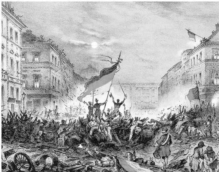
Провозглашение Германии республикой в ноябре 1918 г.

и Парижской коммуны 1 мы никогда бы не совершили Октябрьского переворота, даже имея опыт 1905 г.: ведь и этот наш «национальный» опыт мы проделывали, опираясь на выводы прежних революций и продолжая их историческую линию. А затем весь период контрреволюции был заполнен изучением уроков и выводов 1905 г. Между тем в отношении победоносной революции 1917 г. нами не проделано такой работы, хотя бы и в одной десятой части. Конечно, мы живем не в годы реакции и не в эмиграции. Зато и силы и средства, какими мы располагаем ныне, не идут ни в какое сравнение с теми тяжкими годами. Надо лишь ясно и отчетливо поставить задачу изучения Октябрьской революции как в партийном масштабе, так и в масштабе всего Интернационала. Надо, чтобы вся партия и особенно ее молодые поколения проработали шаг за шагом опыт Октября, который