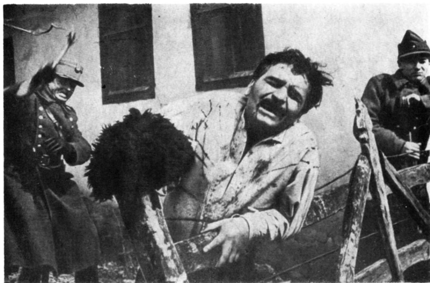
«Красная метель» 1971 год

Фильм «Красная метель» взволновал зрителей по-настоящему: режиссеру В. Паскару удалось передать на экране высокий накал страстей в напряженные моменты революционной борьбы. На студию при-