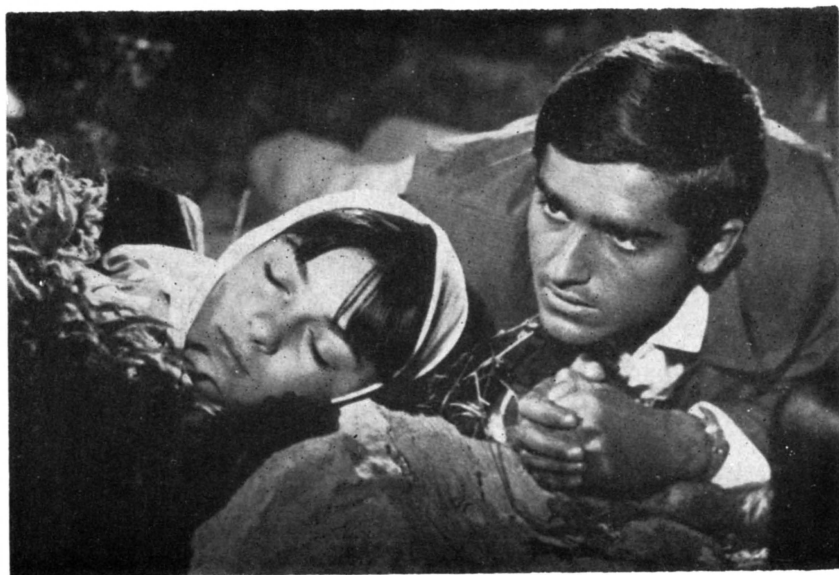
«Красные поляны» 1966 год