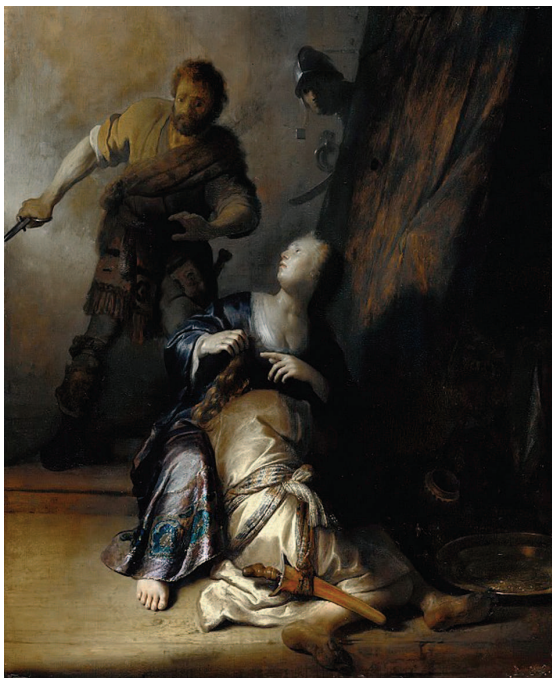
«Самсон и Далила», 1628, доска, масло. Берлинская картинная галерея, Берлин

ему бесконечным источником вдохновения — своих моделей он искал повсюду. Часто на эскизах, картинах и гравюрах он изображал своих близких знакомых и членов своей семьи. Не гнушался он и автопортретами.