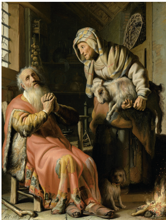
«Товит, подозревающий жену в воровстве», 1626–1627, холст, масло. Рейксмузеум, Амстердам

В 1623 году Рембрандт начал брать уроки у нового учителя, Питера Ластмана, для чего переехал в его амстердамскую мастерскую. Ластман, который в свое время прошел стажировку в Италии и специализировался на исторических, мифологических и библейских сюжетах, оказал сильное влияние на формирование раннего стиля Рембрандта. Пристрастие к пестроте и подробнейшей детализации изображения, свойственное Ластману, надолго стало частью живописного стиля самого Рембрандта. В этом стиле были созданы такие работы, как «Сцена из древней истории» (1626) и «Побиение камня-