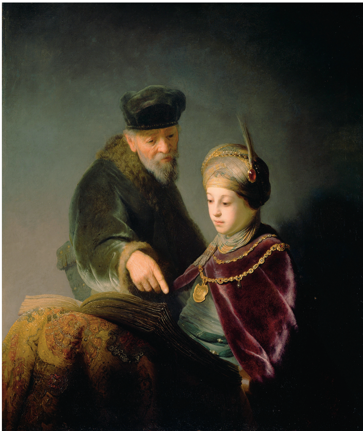
«Молодой ученый и его наставник», 1629–1630, холст, масло. Музей Гетти, Лос-Анджелес