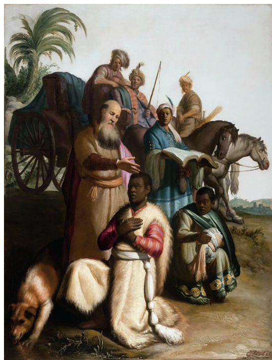
«Крещение евнуха», 1626, дерево, масло. Национальный музей религиозного искусства, Утрехт

ствия: учился он плохо, а вскоре и вовсе изъявил желание сделаться живописцем. Отцу пришлось уступить желанию настойчивого сына, и уже в тринадцать лет тот был отдан учиться живописи. Первым преподавателем Рембрандта стал лейденский живописец Якоб ван Сваненбюрг, специализирующийся на исторических полотнах. В мастерской своего учителя юный Рембрандт пробыл три года, впрочем, нельзя сказать, что за это время он добился каких-то ощутимых успехов, а потому по истечении указанного срока он занялся поисками нового наставника.