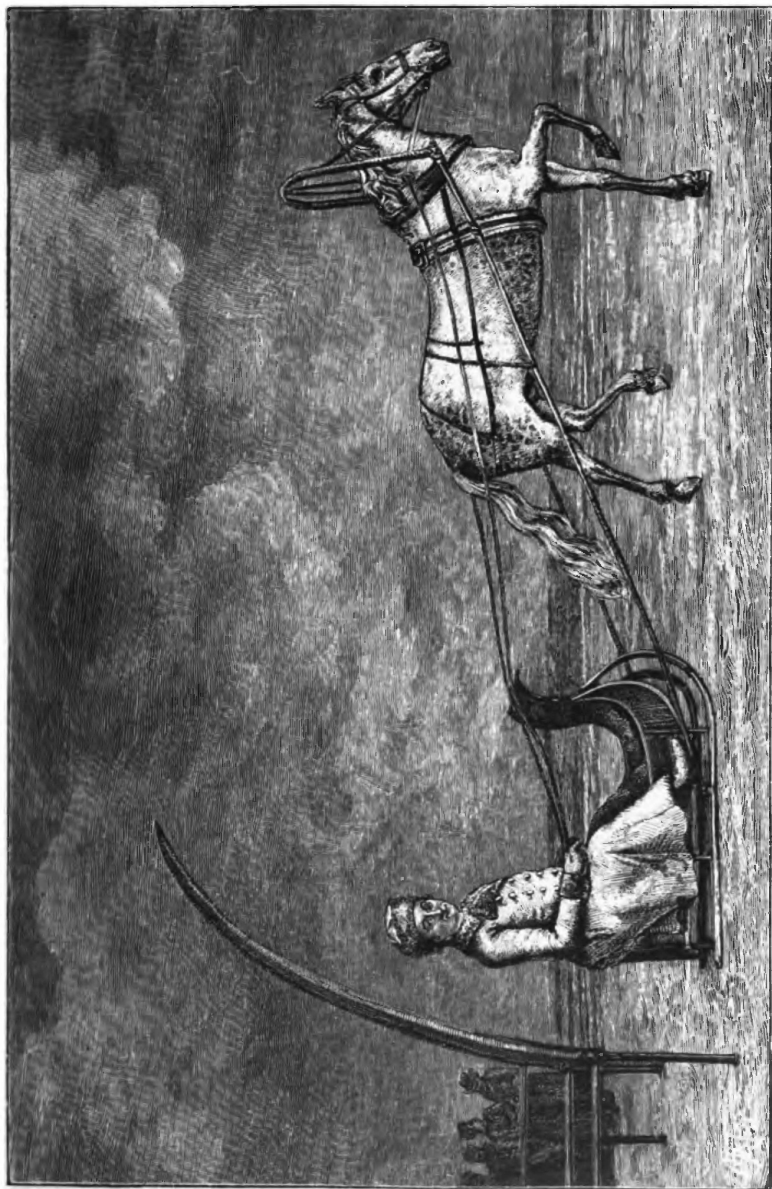
Графъ А. Г. Орловъ-Чесменскій, проѣзжающій своего рысака Барса.