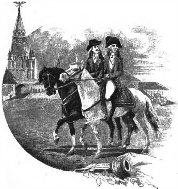
Московскіе франты въ концѣ XVIII вѣка.

Напримѣръ, слово «болванчикъ» было ласкательное—его придавали другъ другу любовники, оно значило то же, что idole de mon ame ; «ахъ, мужчина, какъ ты забавень! Ужестъ, ужестъ! Твои