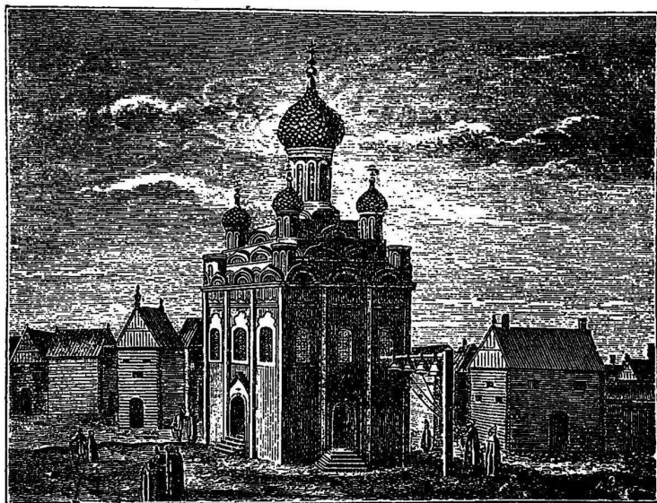
Площадь въ Москвѣ въ концѣ XVII столѣтія.

ныхъ сбереженій. Полна была и государственная казна. Извѣстный келарь Авраамій Палицынъ свидѣтельствуетъ, что во время трехлѣтняго неурожая при Борисѣ Годуновѣ большіе запасы стараго хлѣба сохранились у многихъ хозяевъ и этими запасами населеніе кормилось въ теченіе всего смутнаго времени, когда всякая хозяйственная дѣятельность была почти совсѣмъ прекращена. Вообще же количество обрабатываемой земли въ то время было очень невелико. Земли было много, людей мало.