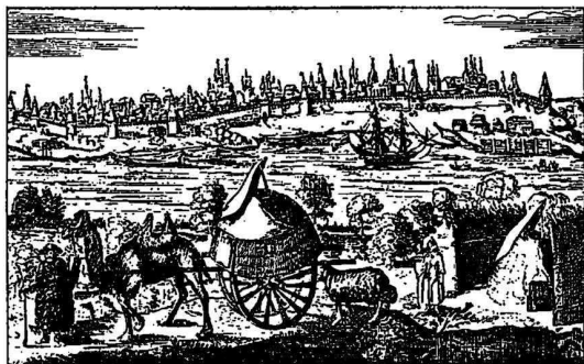
Видъ Астрахани (XVII в.).

Финансовое положеніе государства, при цѣломъ рядѣ трудныхъ войнъ—съ Польшей, Швеціей, Крымомъ—и при экономическомъ разстройствѣ страны, было весьма печально. Въ первые годы царствованія Михаила Теодоровича госу-