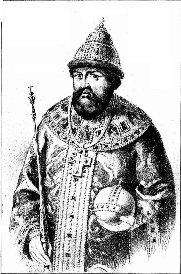
Царь Алексѣй Михайловичъ.