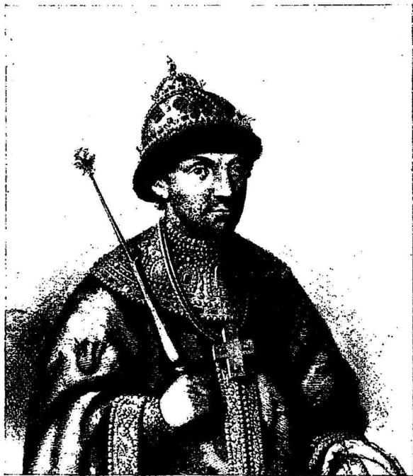
Царь Феодоръ Алексѣевичъ.

Пашня очень часто пустовала тамъ, гдѣ она числилась по писцовымъ книгамъ занятой. Вотъ почему тогдашнее правительство сперва перешло къ обложенію только занятой, не пустыющей земли, а затѣмъ къ подворному обложенію. Подворныя переписи были произведены въ 1646 и