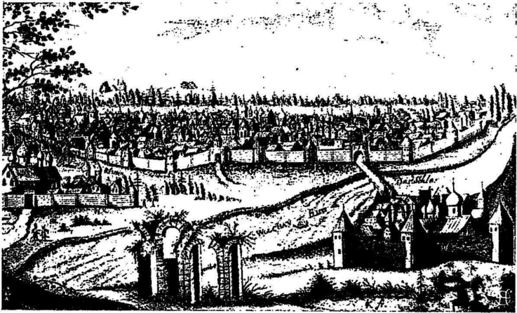
Великій Новгородъ (XVII в.).

Писцовыя книги XVI вѣка дѣлятъ земледѣльческіе классы по ихъ зажиточности на крестьянъ и на бобылей, т.-е. тѣхъ же крестьянъ, но только малоземельныхъ или вовсе