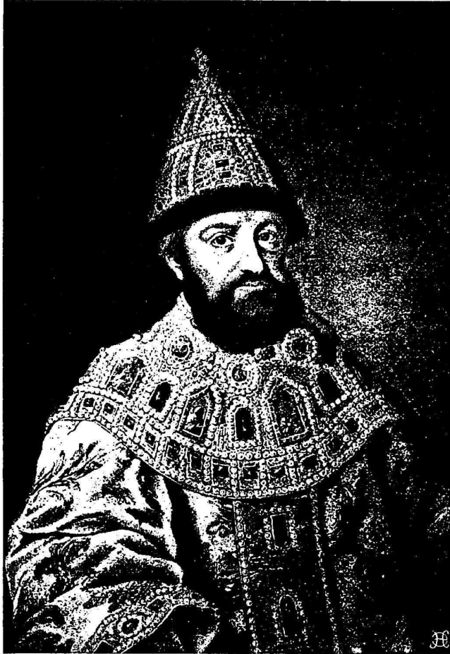
Царь Михаилъ Теодоровичъ.

повсюду въ Московскомъ государствѣ были очень велики. Количество пустошей еще болѣе возрасло послѣ великой смуты, когда было истреблено и разбѣжалось множество народу изъ всѣхъ областей, захваченныхъ смутой. До смуты,