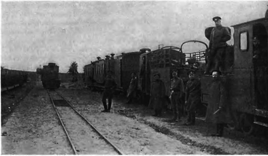
Полевая желѣзная дорога.

Про положеніе дѣлъ на остальномъ театрѣ войны остается добавить не много. У французовъ германцы оживили всюду свои дѣйствія, въ своихъ артиллерійскихъ состязаніяхъ, частныхъ атакахъ, желая лучше замаскировать съвозъ войскъ къ намъ. Не въ силахъ помѣшать существенно продолжающимся продвижкамъ тутъ и тамъ союзниковъ, они стали посылать и сюда изнутри Германіи подкрѣпленія, истощая ихъ запасъ.