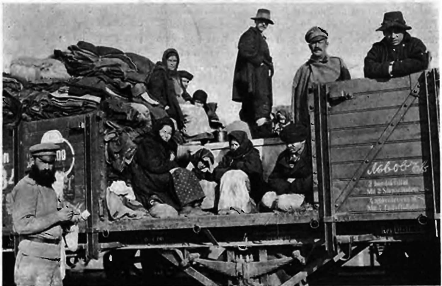
Бѣженцы изъ Галиціи.

вѣстія о ширящемся и все растущемъ переходѣ въ наступленіе нашимъ на достаточно зарывшагося врага, особенно на Люблинскомъ участкѣ. Противникъ убѣ-