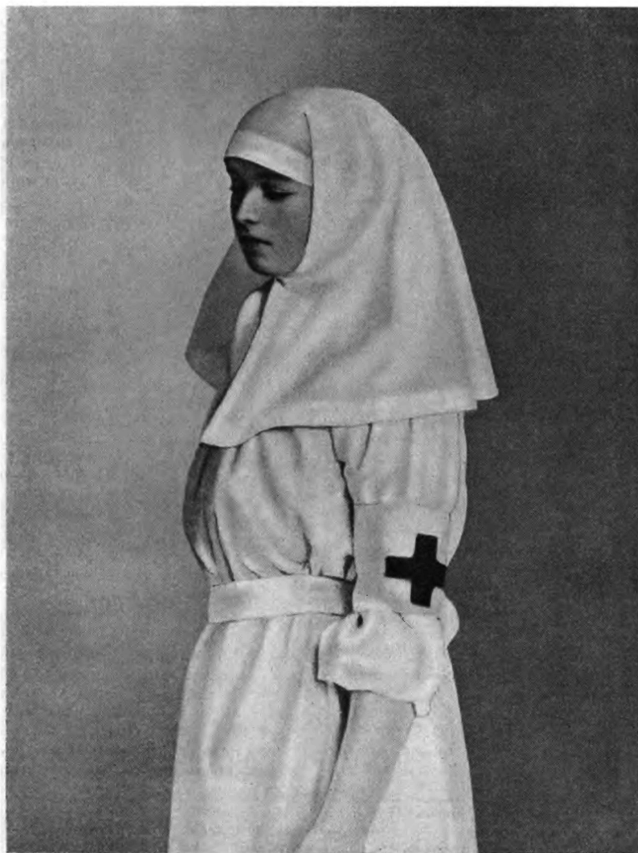
ЕЯ ИМПЕРАТОРСКОЕ ВЫСОЧЕСТВО ВЕЛИКАЯ КНЯЖНА ОЛЬГА НИКОЛАЕВНА.