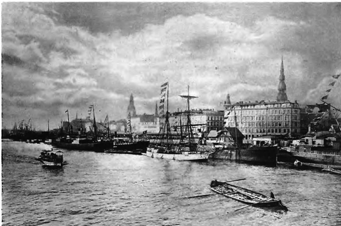
Гор. Рига. Набережная Двины.

скомъ морѣ между Готландомъ и Курляндскимъ берегомъ отрядъ германскихъ судовъ въ составѣ крейсера типа «Аугсбургъ», миноноскоцвѣ типа «Альбатросъ» и трехъ эскадренныхъ миноноскоцвѣ и немедленно вступили съ противникомъ въ бой, стремясь отрѣзать ему путь отступленія. Завязался артиллерійскій бой. Попытка непріятельскихъ миноноскоцвѣ произвести минную атаку окончилась неудачей. Мгла мѣшала точности стрѣльбы и затягивала бой. Однако, вскорѣ крейсеръ противника, воспользовавшись своей быстроходностью, прорвался на югъ, тогда какъ миноноскоцвѣ вслѣдствіе стремительными повторными минными атаками и устройствомъ дымовой завѣсы облегчить положеніе «Альбатроса». Несмотря на это, черезъ часъ по началу бою, на «Аль-