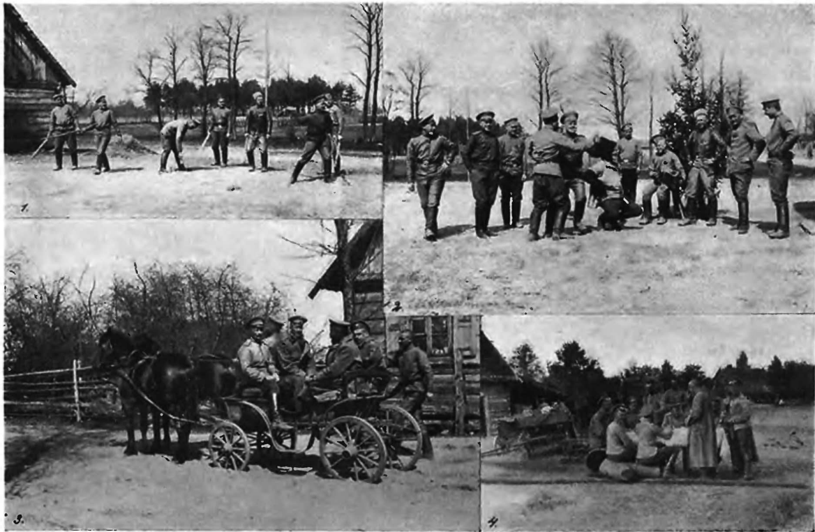
Въ часы досуга. 1) Игра въ городки. 2) Пляска. 3) На прогулку. 4) Обѣдъ.

границы (рр. Выжица, Поръ, г. Замостье, с. Жуковъ...) и затѣяли упорные бои. Одинъ гвардейскій полкъ иѣмцевъ почти былъ уничтоженъ нами (с. Жуковъ). На восточномъ же фронтѣ мы еще находились въ галиційскихъ предѣлахъ (Сокаль—Валичъ—Румынская граница) и вели еще бои на Гнилой Липѣ, отразивъ цѣлый рядъ атакъ противника съ большимъ для него урономъ, съ захватомъ пулеметовъ, тысячи пѣльныхъ, и подготавливая въ тылу нашемъ болѣе прочную позицію на р. Золотой Липѣ, куда и собирались переходить, давъ противнику 18-го числа даже захватить одну изъ переправъ черезъ Гнилую Липу.