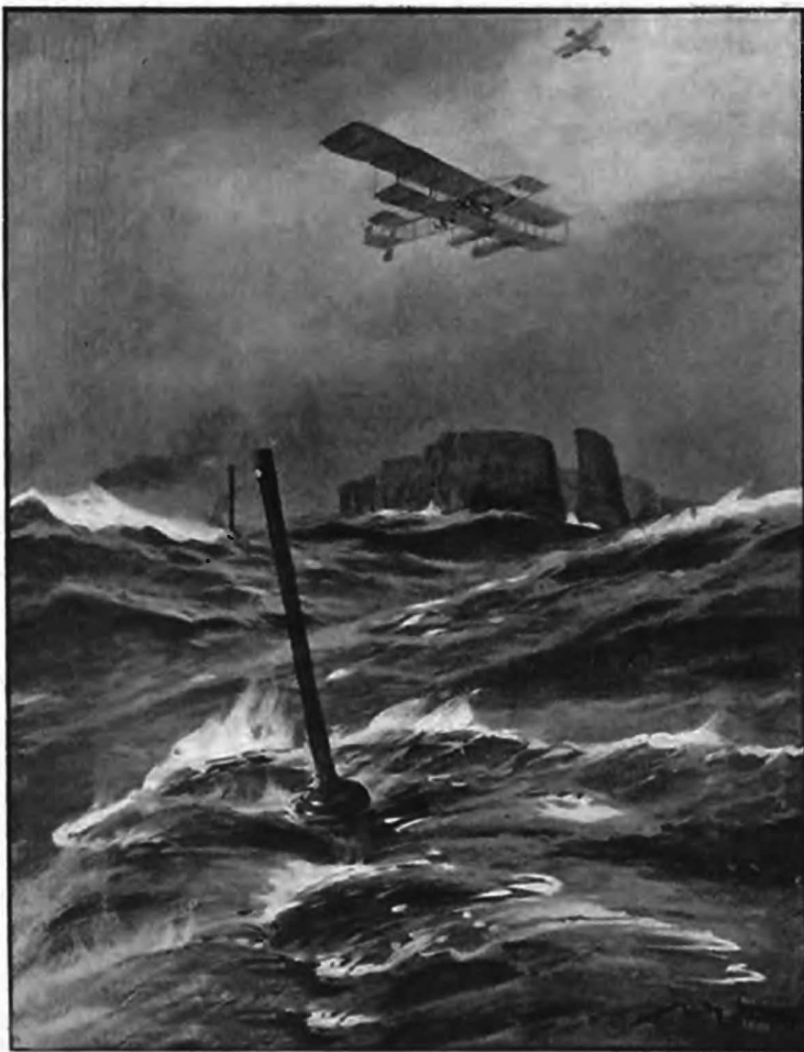
Германскіе цеппелины и подводныя лодки, маневрирующіе близъ Гельголанда.

нить свой долгъ передъ родиной, если уничтожить все то, надъ чѣмъ онъ трудился въ расчетѣ на долгіе годы мирной жизни. Мы не должны оставлять нѣмцамъ ничего, что могло бы оказаться полезнымъ для ихъ войскъ. Пусть наши арьергардные отряды, прикрывая отходы главныхъ силъ, оставляютъ послѣ себя одну голую землю, лишенную волнующагося моря зелени. Въ настоящую минуту нельзя щадить интересы отдѣльных лицъ; затѣмъ, въ свое время, все будетъ возвращено сторицею,—теперь же у насъ должно быть одно лишь сознаніе необходимости раздавить презрѣннаго противника, потерявшаго право на уваженіе и въру къ себѣ. Россія пережи-