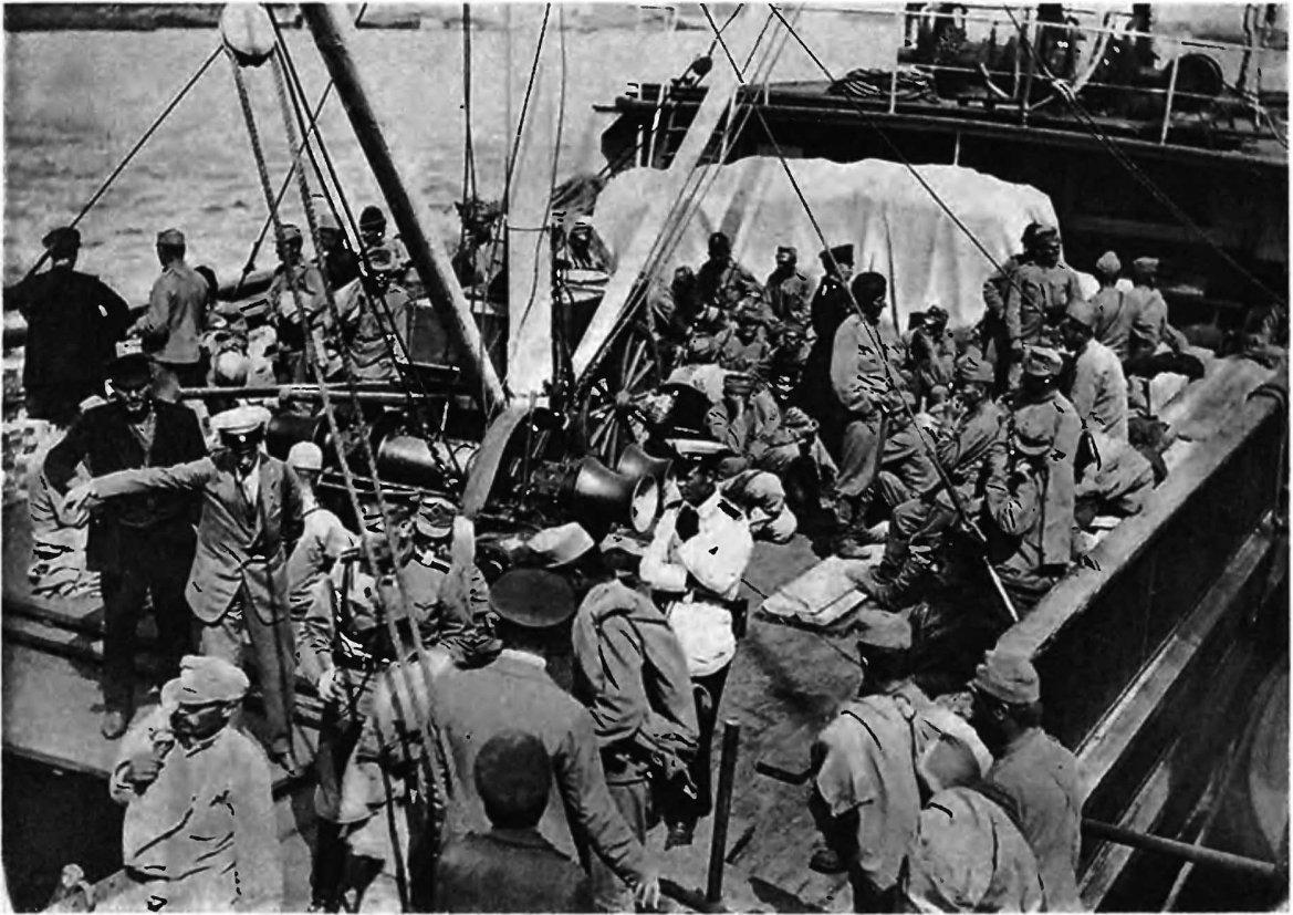
Плѣнные австрійцы и пѣмцы на пароходѣ на Невѣ.

чали собственно съ 21-го, когда, скопивъ порядочный кулакъ на Люблинскомъ участкѣ, стали бить имъ во флангъ пѣмцамъ. Первый такой ударъ былъ у с. Вильколазь, которое мы поэтому и называемъ, какъ имя радостное, съ которымъ надо соединить воспоминаніе о лихомъ боѣ: больше двухъ тысячъ труповъ пѣмцевъ усеяло нашъ фронтъ и столько же живыхъ съ тремя десятками ихъ офицеровъ было вырвано изъ разсирѣпѣвшихъ массъ противника. Последний былъ сильно побитъ и въ своей попыткѣ прорваться въ томъ мѣстѣ (с. Крыловъ), гдѣ нашъ сѣверный галиційскій фронтъ соединенъ съ восточнымъ галиційскимъ же участкомъ борьбы.