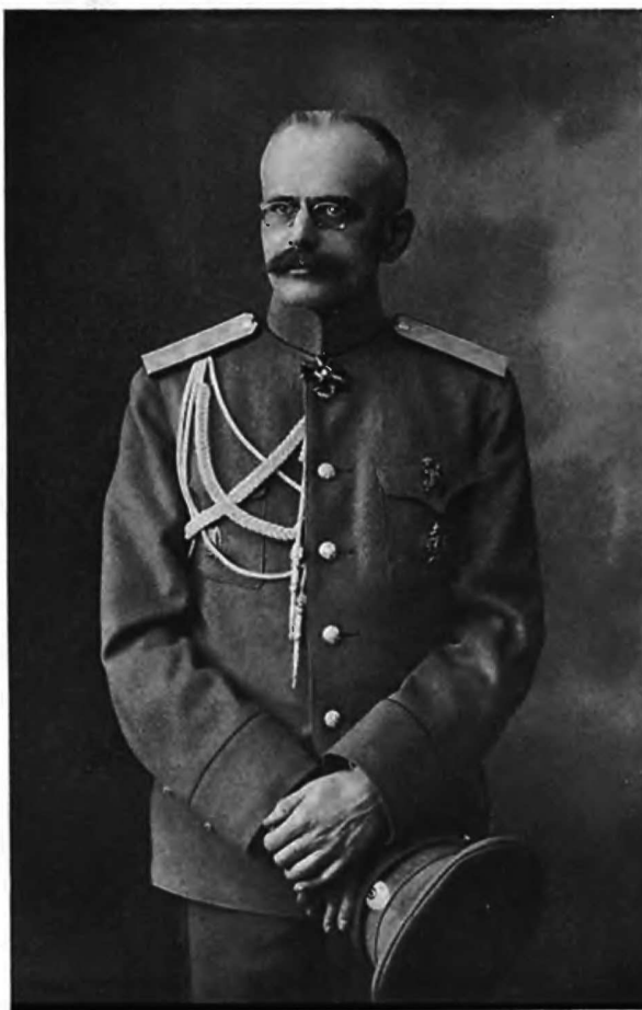
Вновь назначенный Помощникъ Военнаго Министра генераль-отъ-инфантеріи Михаилъ Алексѣевичъ Бѣляевъ.

Понемногу ликвидируется Мясоедовская шайка, и еще трое измѣнниковъ нашли достойную ихъ позорную дѣла смерть на висѣлицѣ.