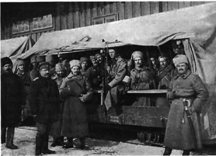
Перевозка войскъ по полевой желѣзнодорожѣ.

на остальномъ фронтѣ. Австрійцы обороной попутныхъ укрѣпленныхъ позицій на триестскомъ направленіи и нападеніями на заслоны стараются помѣшать имъ.