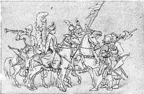
Польское войско XVII вѣка.

Скоро подошли къ Москвѣ поляки, чтобы использовать сдѣланное руками русскихъ измѣнниковъ, смутьяновъ и малодушныхъ. Жолкѣвскій съ своими войсками расположился лагеремъ на Дѣвичьемъ полѣ. Москва, уже заранѣе охваченная иезуит-