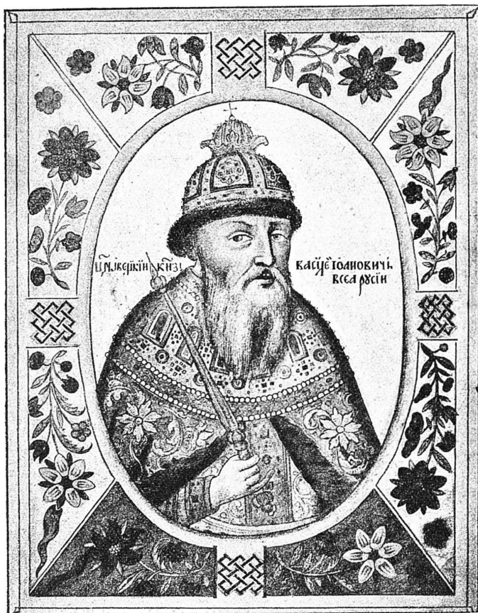
Царь Василій Іоанновичъ Шуйскій. (По Титулярнику).

ство почти до полной гибели. Правительство семибоярщины не отличалось ни силою, ни мужествомъ, ни прозорливостью. Оно было безсильно избрать царя изъ среды русскихъ людей и, опасаясь, что Москву и государство захватитъ Лжедмитрій II, противо-