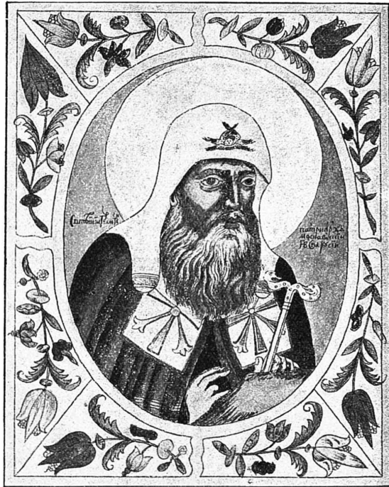
Святѣйшій патріархъ Гермогенъ. Скончался 17 февраля 1612 года.

Червонной и Черной Руси католичили и полячили высшіе классы народа, а низшіе, обращенные въ крѣпостное состояніе, совращали изъ православія въ унію, подвергая жестокиѣмъ притѣсненіямъ самую русскую народность. Ихъ близорукость не смущало и то, что поляки поддерживали и Лжедмитрія I, какъ тайнаго католика, и Лжедмитрія II, какъ орудіе расплаты Россіи, что они еще недавно, подъ предводительствомъ пановъ Сапѣги и