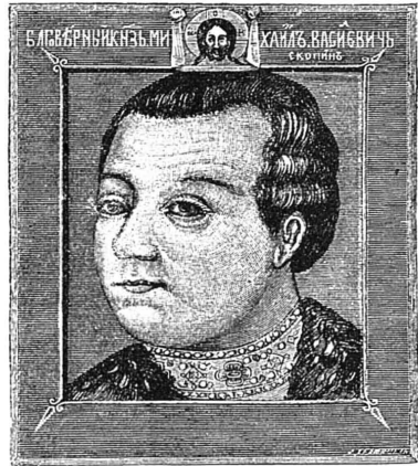
Князь М. В. Скопинъ-Шуйскій. Съ современнаго портрета.

Онъ самъ говоритъ въ этихъ «Запискахъ», что раньше «онъ посылалъ тайнымъ образомъ въ Москву много писемъ съ универсалами (по-нынѣшнему — прокламаціями, а по-старо-русски — подметными грамотами) для возбужденія ненависти противъ царя Василія, и указывалъ въ нихъ, какъ въ царствѣ Московскомъ въ его правленіе все идетъ дурно и какъ чрезъ него и за него безпрестанно проливалась христіанская кровь; эти универсалы разбрасывали по улицамъ въ Москвѣ. Въ частныхъ же письмахъ, подготовляя заговоръ, онъ давалъ обѣщанія нѣкоторымъ лицамъ и обнадеживалъ ихъ, отчего де умы волновались. Не довольствуясь такою пропагандою, онъ заключалъ съ податливыми на измѣну лицами и прямыя договоры. Его договорная записка съ княземъ Елецкимъ и нѣкоторыя другія бумаги произвели въ Москвѣ такое агитаціонное возбужденіе, что, какъ