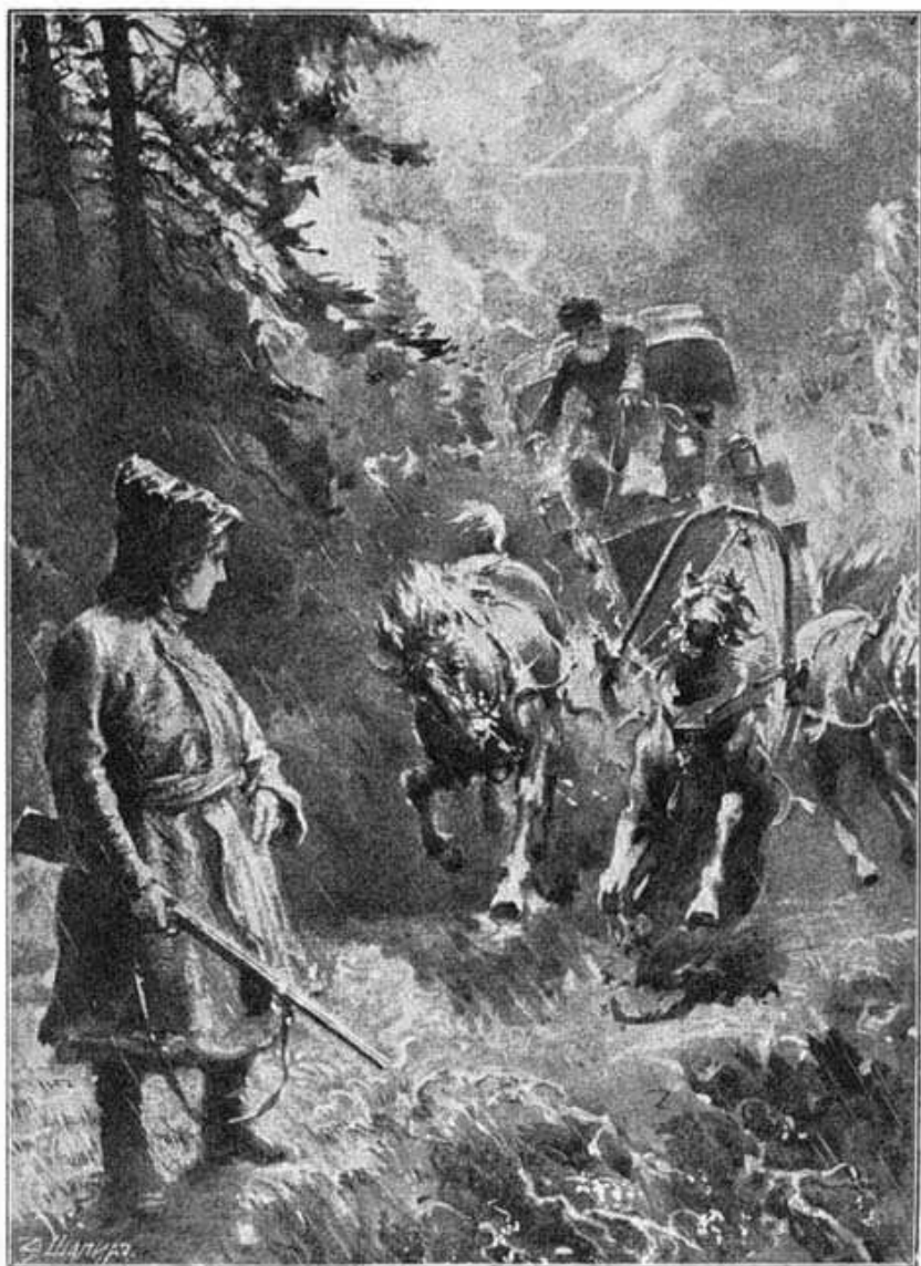
Молнія освітила чорну фігуру в конях...