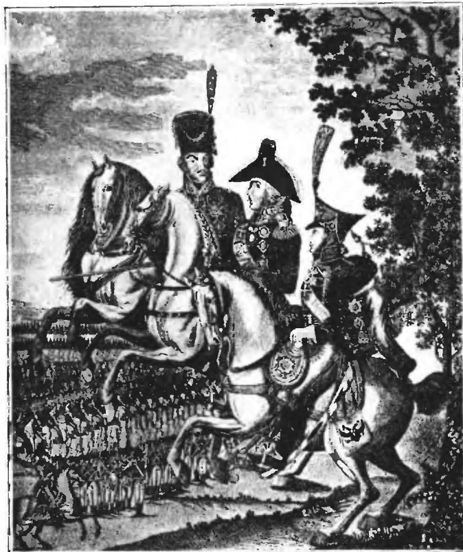
Кн. Кутузовъ Смоленскій, гр. Витгенштейнъ, гр. Платовъ.

18 августа главныя силы арміи начали отступать отъ с. Царева-Займища поспѣшно и налегкѣ; притомъ настолько налегкѣ, что при полкахъ было оставлено всего лишь по два патронныхъ ящика; даже лазаретныя линейки были отправлены съ прочими обозами окружными проселочными дорогами, чтобы не задержать отступленія войскъ. Князь Кутузовъ 18 августа находился уже не въ Царевѣ - Займищѣ, а въ мѣстечкѣ «Старая Деревня» и оттуда послалъ князю Багратиону слѣдующее собственноручное сообщеніе. «По объясненію со мною Михаила Богдановича, что кавалерія 1 арміи за употребленіемъ оной чрезъ долгое время въ авангардѣ вмѣсто казацкихъ полковъ, при оной не состоящихъ, ослабѣла до того, что на нѣкоторое время нужно отдохновеніе и, слѣдственно, замѣненіе оной другою кавалеріею, я посему обращаюсь къ вашему сіятельству съ тѣмъ, чтобы вы, милостивый государь мой, приказали завтрашняго числа въ помощь арьергарду 1 арміи въ приличномъ мѣстѣ выставить 15 эскадроновъ».