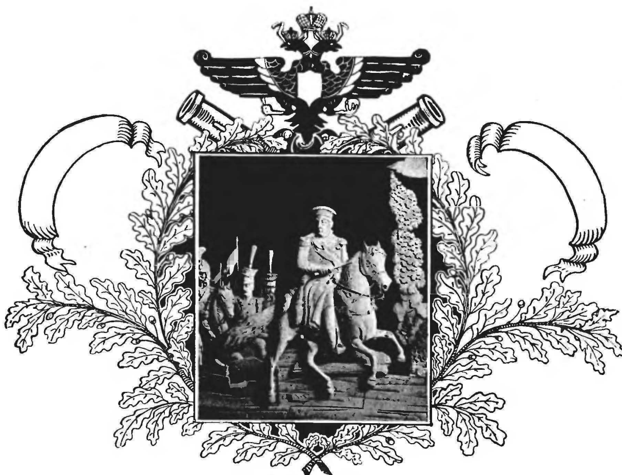
М. И. Кутузовъ.