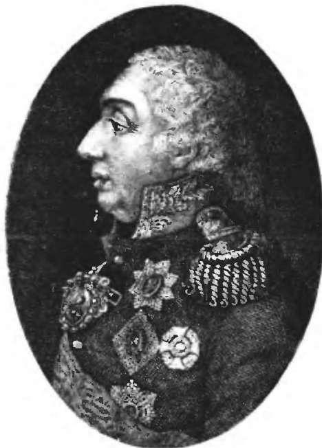
Кн. М. И. Кутузовъ.

Михаиль Иларіоновичъ Голенищевъ-Кутузовъ родился въ 1745 г. и въ данное время ему шелъ 78 годъ. За свою долгую жизнь М. И. Кутузовъ прошелъ хорошую военную школу подъ руководствомъ самого Суворова. Онъ былъ умный, способный, широко по тому времени образованный человекъ, за долгую жизнь, прожитую не даромъ, хорошо постигшій и людей и тѣ сферы военной, свѣтской дипломатической дѣятельности, гдѣ ему приходилось вращаться и гдѣ онъ всегда былъ и выступалъ замѣтной величиной. Человекъ придворный и свѣтскій, Кутузовъ глубоко постигъ одно изъ правилъ этой жизни, гласившее, что языкъ данъ человеку затѣмъ, чтобы скрывать свои мысли. Обходительный и ловкій, онъ умѣлъ сдѣлать себя необходимымъ при дворѣ Екатерины такъ же, какъ и при дворѣ императора Павла. Императрица Екатерина очень отличала Кутузова и всегда говорила о немъ съ похвалой, называя его «мой Кутузовъ», а императоръ Павелъ, какъ говорятъ, прочилъ Кутузова на должность с.-петербургскаго военнаго губернатора, когда колебался въ своемъ довѣріи къ Палену. «Куртизанъ», «придворный человекъ», «вездѣ уживется», говорили про Кутузова тѣ, кто ему завидовалъ. И тутъ было кое-что справедливаго.