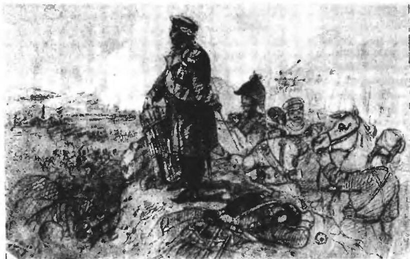
М. И. Кутузовъ, князь Смоленскій (М. Орловъ. 1888 г.).