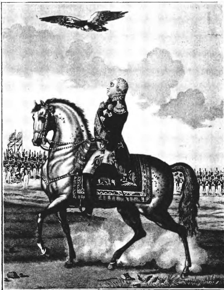
„Ген.-фельдм. кн. Голенищевъ-Кутузовъ Смоленскій, принимающій главное начальствованіе въ авг. 1812 г.“ 1).

Императоръ Александръ Павловичъ не любилъ Кутузова и не довѣрялъ ни его военнымъ способностямъ, ни личнымъ свойствамъ, такъ какъ зналъ, что Кутузовъ не признавалъ его военныхъ талантовъ, которыми Александру Павловичу такъ хотѣлось обладать. Человѣкъ екатерининской эпохи и суворовской выучки, Кутузовъ былъ противъ павловской муштры войскъ на прусскій образецъ и рѣзко осуждалъ всякую парадоманію, все то, что такъ по гатчинскимъ воспоминаніямъ любилъ императоръ Александръ. Расходились оба — царь и