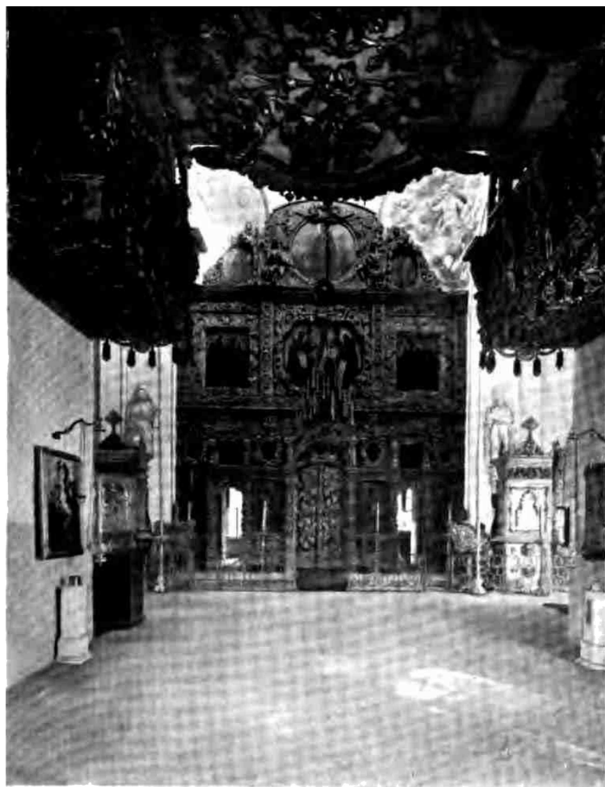
Внутренній видъ храма.