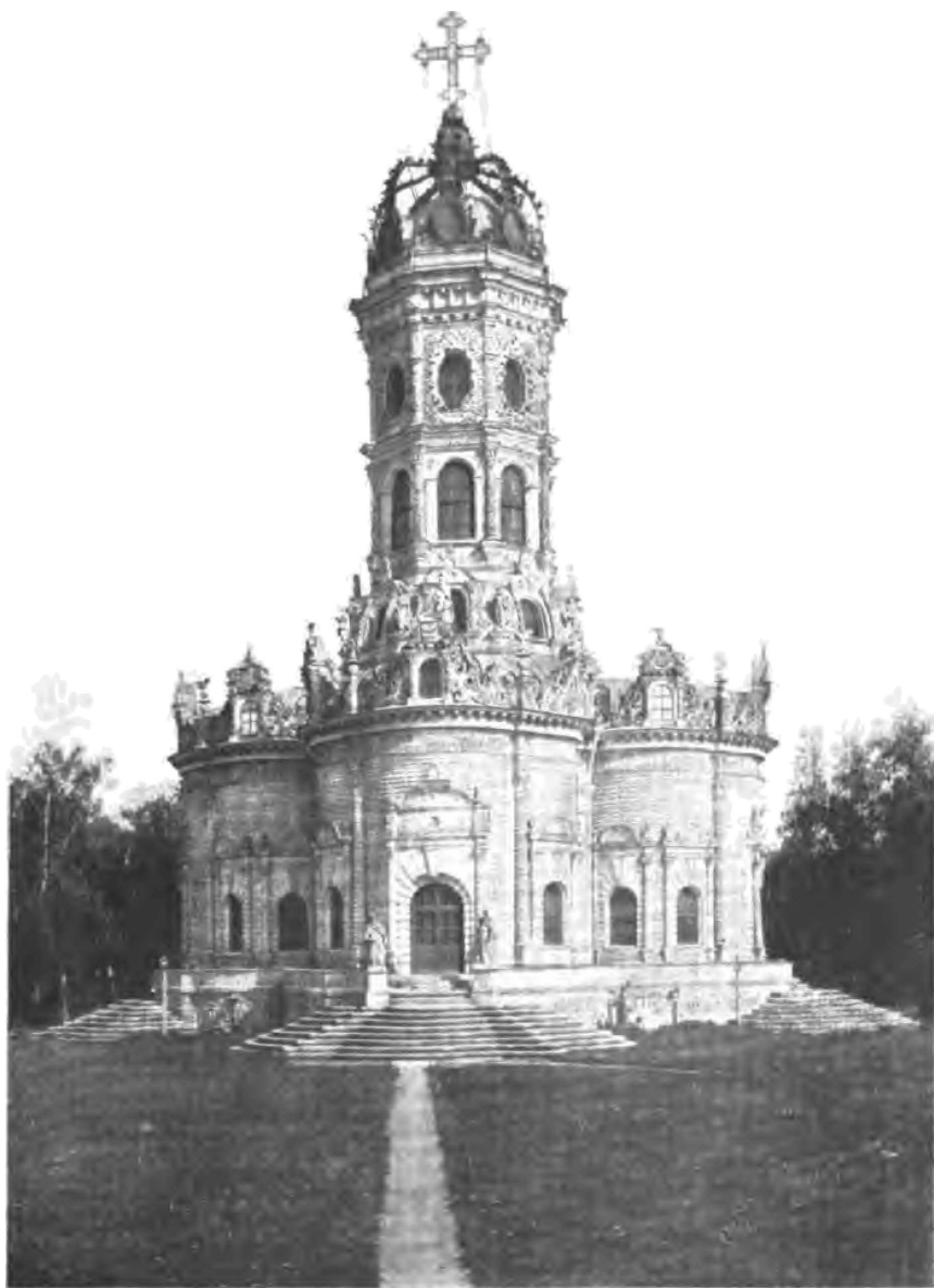
Храмъ Знаменія Пресвятыя Богородицы въ Дубровицахъ.