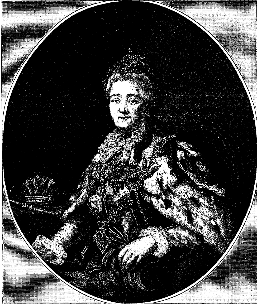
Императрица Екатерина II.

Затѣмъ начался цѣлый рядъ великолѣпныхъ придворныхъ и народныхъ празднествъ, данныхъ императрицею и ея вельможами. «До поста осталось какихъ нибудь двѣ недѣли», писала въ февралѣ 1778 года Екатерина Гримму, «и между тѣмъ у насъ будетъ одиннадцать маска-