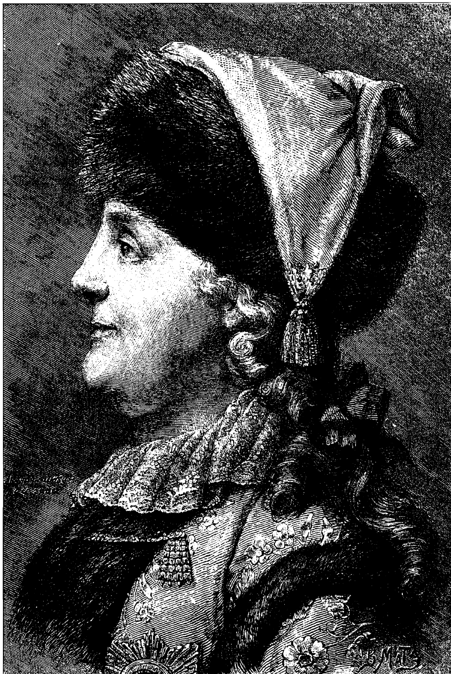
Императрица Екатерина II въ 1794 году.

Съ портрета того времени, сдѣланнаго съ натуры карандашомъ Шубинимъ.