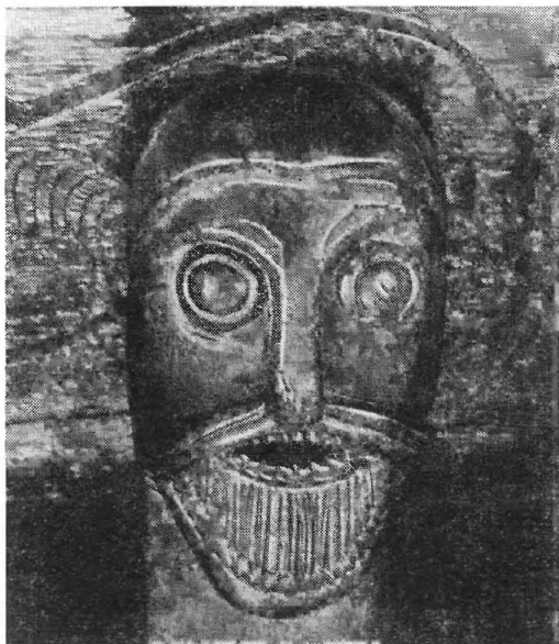
Изображение человеческой головы, дерево. Повозка из погребения в Усеберге, Норвегия

шенно иной, романтический взгляд на деяния норманнов. Эти историки, впадая подчас в безудержное приукрашивание жизни отдаленных предков теперешних исландцев и датчан, норвежцев и шведов, видели в них сказочных витязей и героев, воплощавших всевозможные доблести. Но подобные воззрения внушали серьезным ученым большое недоверие.