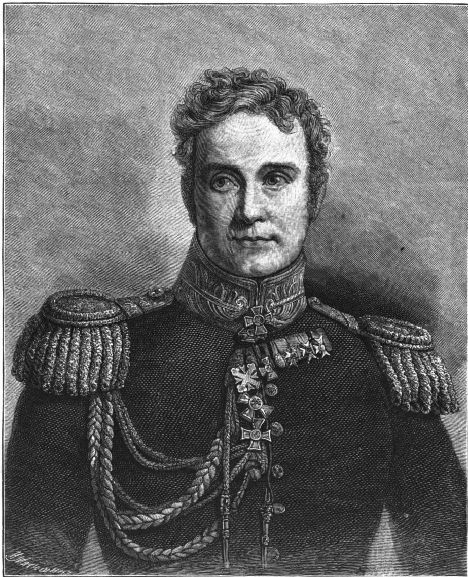
ГЕНЕРАЛЪ-АДЪЮТАНТЪ ГРАФЪ АЛЕКСАНДРЪ ФРАНЦОВИЧЪ МИШО-ДЕ-БОРЕТУРЪ.