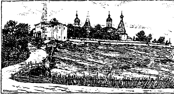
Видъ Терапонтова монастыря съ южной стороны.