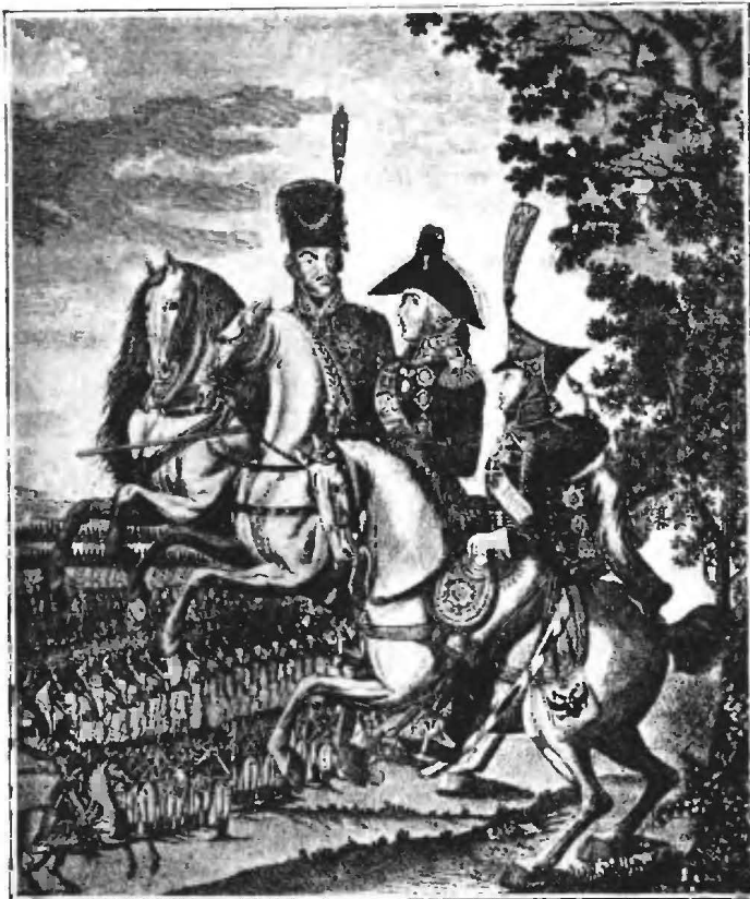
Кн. Кутузовъ Смоленскій, гр. Витгенштейнъ, гр. Платовъ (К. Анисимовъ).

18 августа главныя силы арміи начали отступать отъ с. Царева-Займища поспѣшно и налегкѣ; притомъ настолько налегкѣ, что при полкахъ было оставлено всего лишь по два патронныхъ ящика; даже лазаретныя линейки были отправлены съ прочими обозами окружными проселочными дорогами, чтобы не задержать отступленія войскъ. Князь Кутузовъ 18 августа находился уже не въ Царевѣ - Займищѣ, а въ мѣстечкѣ «Старая Деревня» и отсюда послалъ князю Багратиону слѣдующее собственноручное сообщеніе. «По объясненію со мною Михаила Богдановича, что кавалерія 1 арміи за употребленіемъ оной чрезъ долгое время въ авангардѣ вмѣсто казацкихъ полковъ, при оной не состоящихъ, ослабѣла до того, что на нѣкоторое время нужно отдохновеніе и, слѣдственно, замѣненіе оной другою кавалеріею, я посему обращаюсь къ вашему сіятельству съ тѣмъ, чтобы вы, милостивый государь мой, приказали завтрашняго числа въ помощь арьергарду 1 арміи въ приличномъ мѣстѣ выставить 15 эскадроновъ».