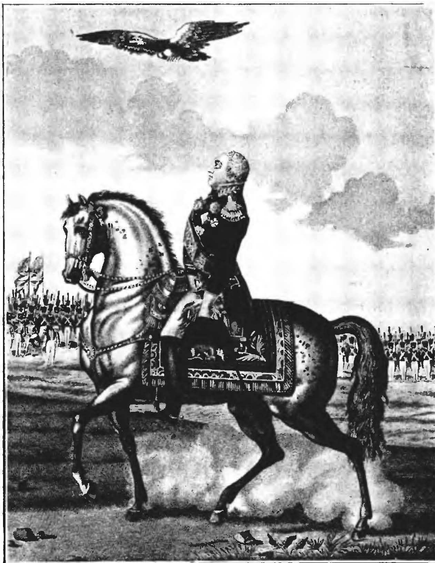
„Ген.-фельдм. кн. Голенищевъ-Кутузовъ Смоленскій, принимающій главное начальствованіе въ авг. 1812 г.“ 1)

Императоръ Александръ Павловичъ не любилъ Кутузова и не довѣрялъ ни его военнымъ способностямъ, ни личнымъ свойствамъ, такъ какъ зналъ, что Кутузовъ не признавалъ его военныхъ талантовъ, которыми Александру Павловичу такъ хотѣлось обладать. Человѣкъ екатерининской эпохи и суворовской выучки, Кутузовъ былъ противъ павловской муштры войскъ на прусскій образецъ и рѣзко осуждалъ всякую парадоманію, все то, что такъ по гатчинскимъ воспоминаніямъ любилъ императоръ Александръ. Расходились оба — царь и