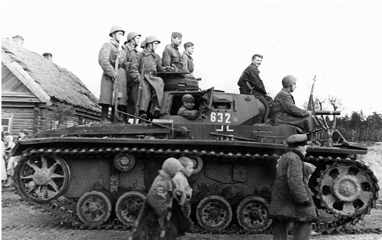
Бойцы Красной Армии отправляются в бой на трофейных танках Pz.III и Pz.IV. На нижнем снимке хорошо видна эмблема 18-й танковой дивизии вермахта и полковой знак 18-го танкового полка нанесенные на башне танка Pz.IV. Западный фронт, сентябрь 1941 года.