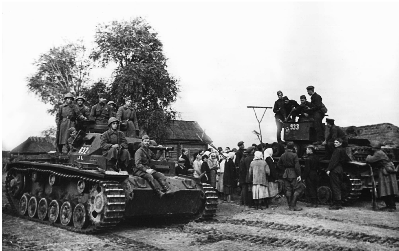
Бойцы Красной Армии на трофейных танках Pz.III и Pz.IV. Западный фронт, сентябрь 1941 года.