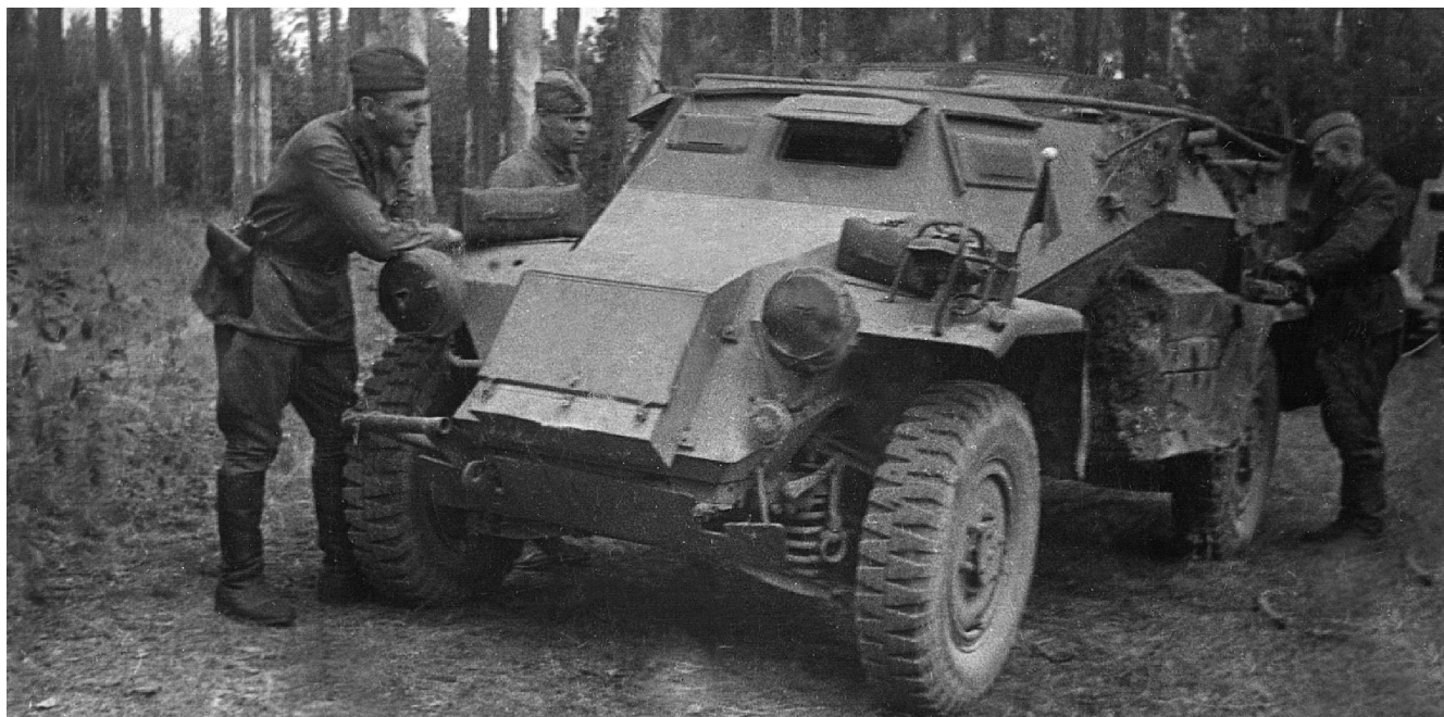
Захваченный немецкий броневладелец Sd.Kfz.261 на службе в Красной Армии, Западный фронт, август 1941 года. Машина перекрашена в стандартный советский защитный цвет 4 БО, на левом крыле укреплен красный флажок.