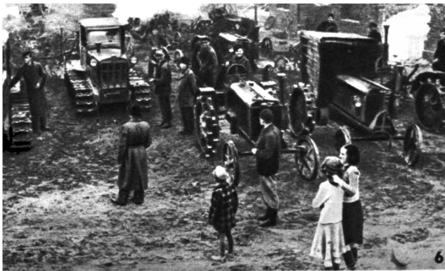
6. Фашистская Германия гнала к Сталинграду танки. Нынче Сталинград шлет демократической Германии тракторы. Машинопрокатные станции, вроде этой в Ной-Рогентин, которую вы видите на снимке, хорошо служат крестьянам, получившим землю. Тракторы с со-