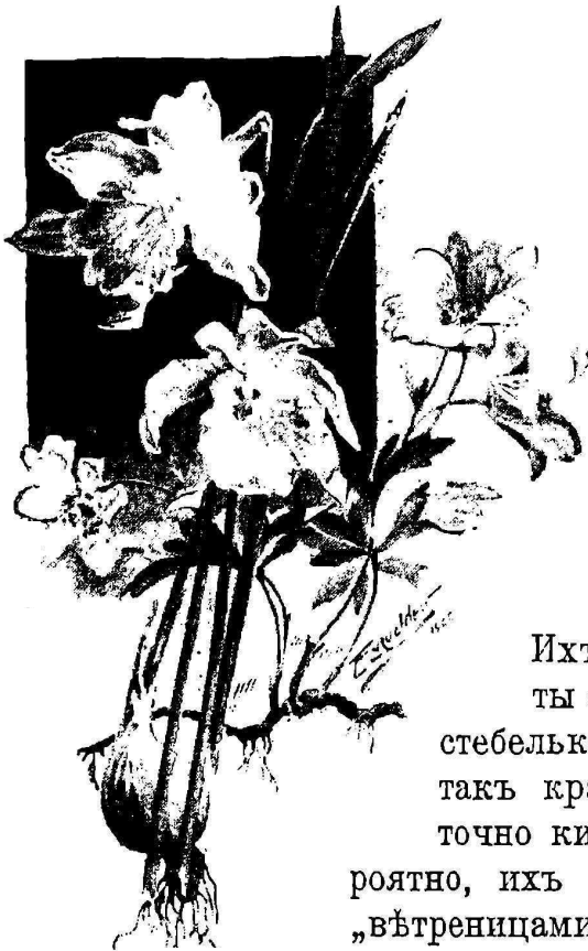
Рис. 1. Нарциссъ и вѣтреница.

подъ снѣга, тоже вырастаютъ изъ луковицы.