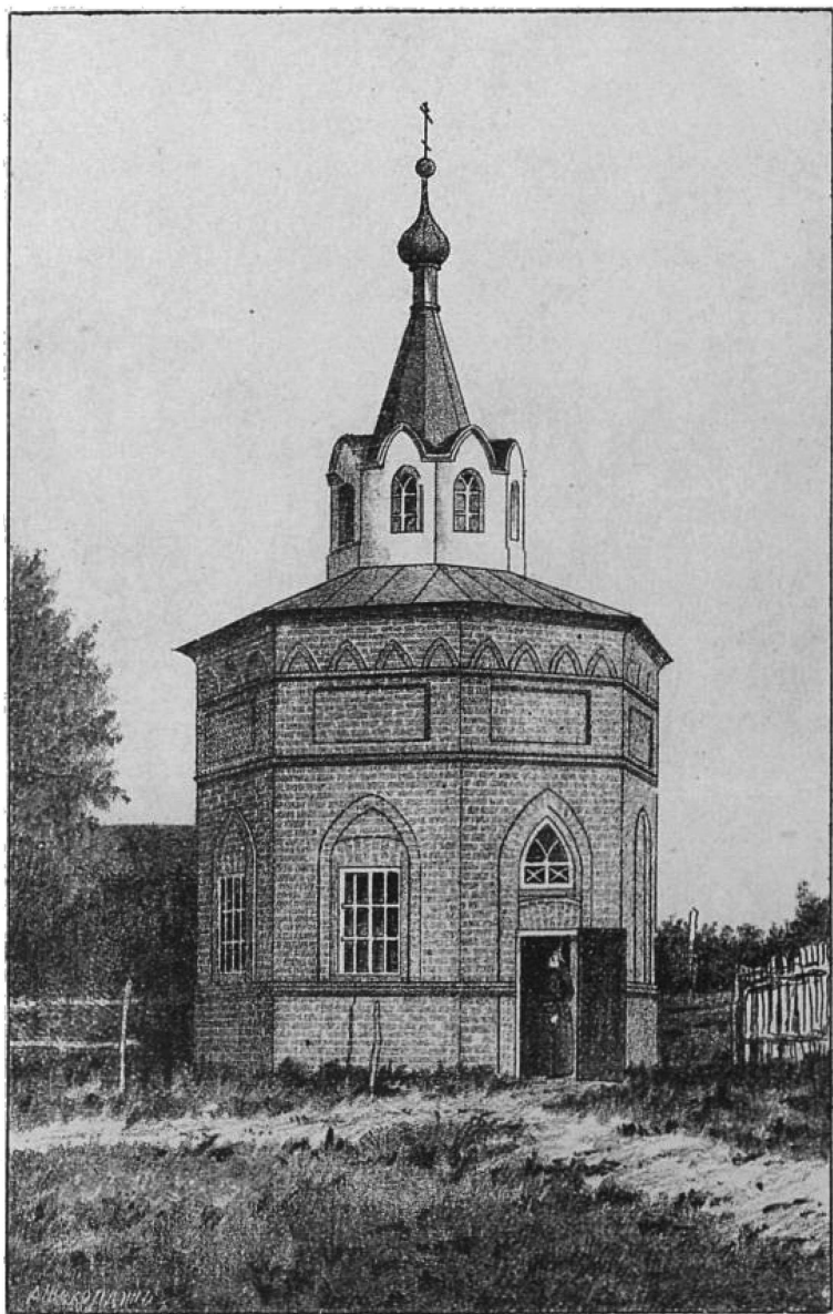
Часовня надъ дубомъ.

Къ стр. 2. Историко-Археологич. описаніе Тихоновой Калужской пустыни. Изд. подъ редакціею И. Токмакова.