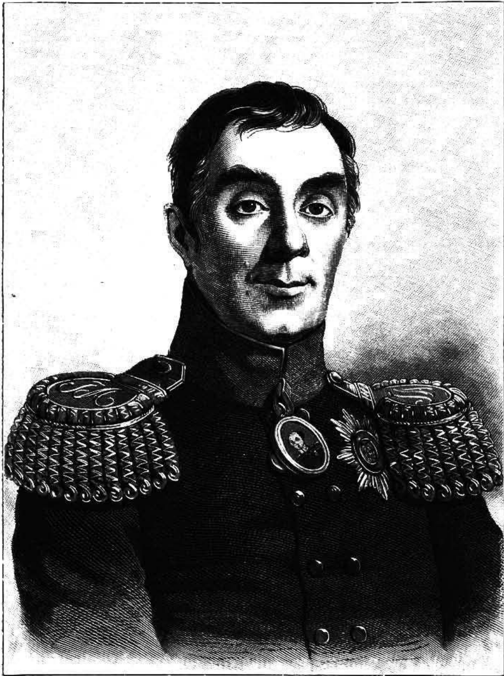
Графъ Алексѣй Андреевичъ Аракчеевъ.

Съ литографіи, сдѣланной съ портрета, находящагося въ «Военной галереѣ» Зимняго дворца.