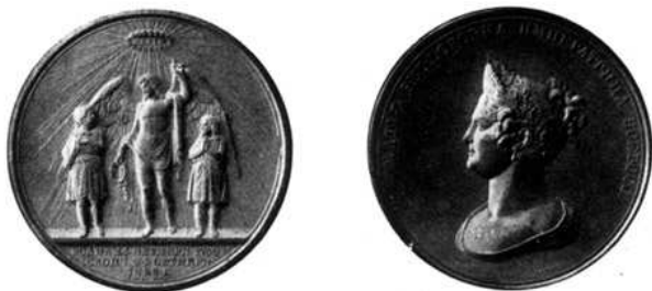
Медаль въ память кончины Императрицы Маріи Феодоровны.

Императрица просила Императора Николая Павловича сохранить въ институтахъ пансіонерокъ ея имени, продолжать