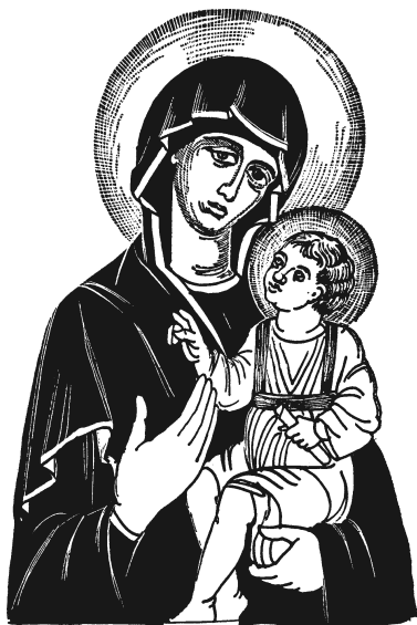
Рис. 2. Икона «Богоматерь Одигитрия»

ло поражение Максенцию, и Константин приказал, чтобы орлов, которые изображались на штандартах римских легионеров, заменили увиденным им знаком. Кроме того, он прекратил римскую практику использования креста в качестве орудия пытки. Впредь он должен был восприниматься как символ христианства. Евсевий утверждает, что видел знамя с новым рисунком, с которым Константин шел на бой с Максенцием. Однако несмотря на то, что Константин продолжал использовать его как свой labarum , то есть штандарт, он оставался язычником и