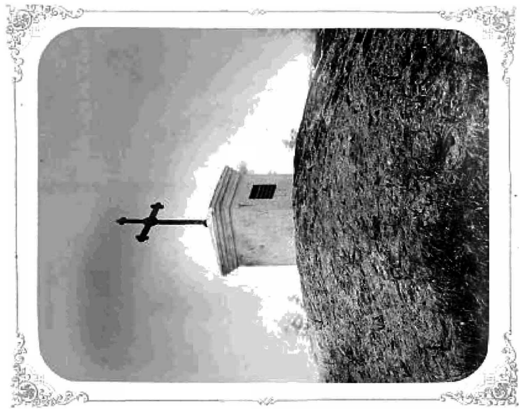
ПАМЯТНИКЪ НАДЪ РУССКИМИ УБИТЫМИ ПРИ ОСАДѢ АКЪ-КЕЧЕТЕ.