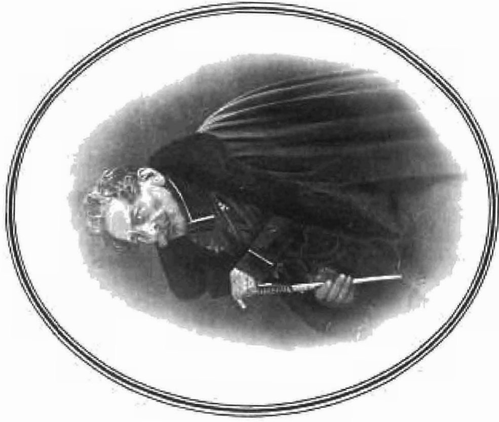
ОРЕНБУРГСКИЙ ГЕНЕРАЛЪ ГУБЕРНАТОРЪ И КОМАНДУЮЩІЙ ПИНСКИМИ ПУСКИМИ ПРЕЛЮБЪ КОРЯУСА