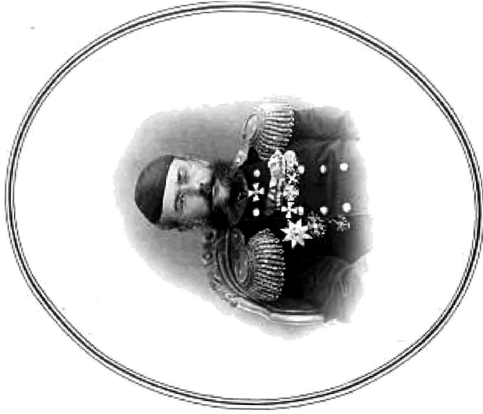
НАЧАЛЬНИКЪ ЗАБАЙКАЛЬСКАГО ОКРУГА ГЕНЕРАЛЬ-МАЮРЪ А. К. АБРАМОВЪ.