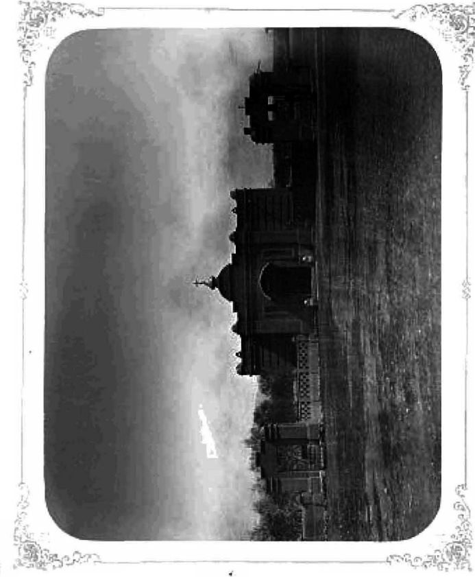
ВЪ П. АХЛД - АТА.