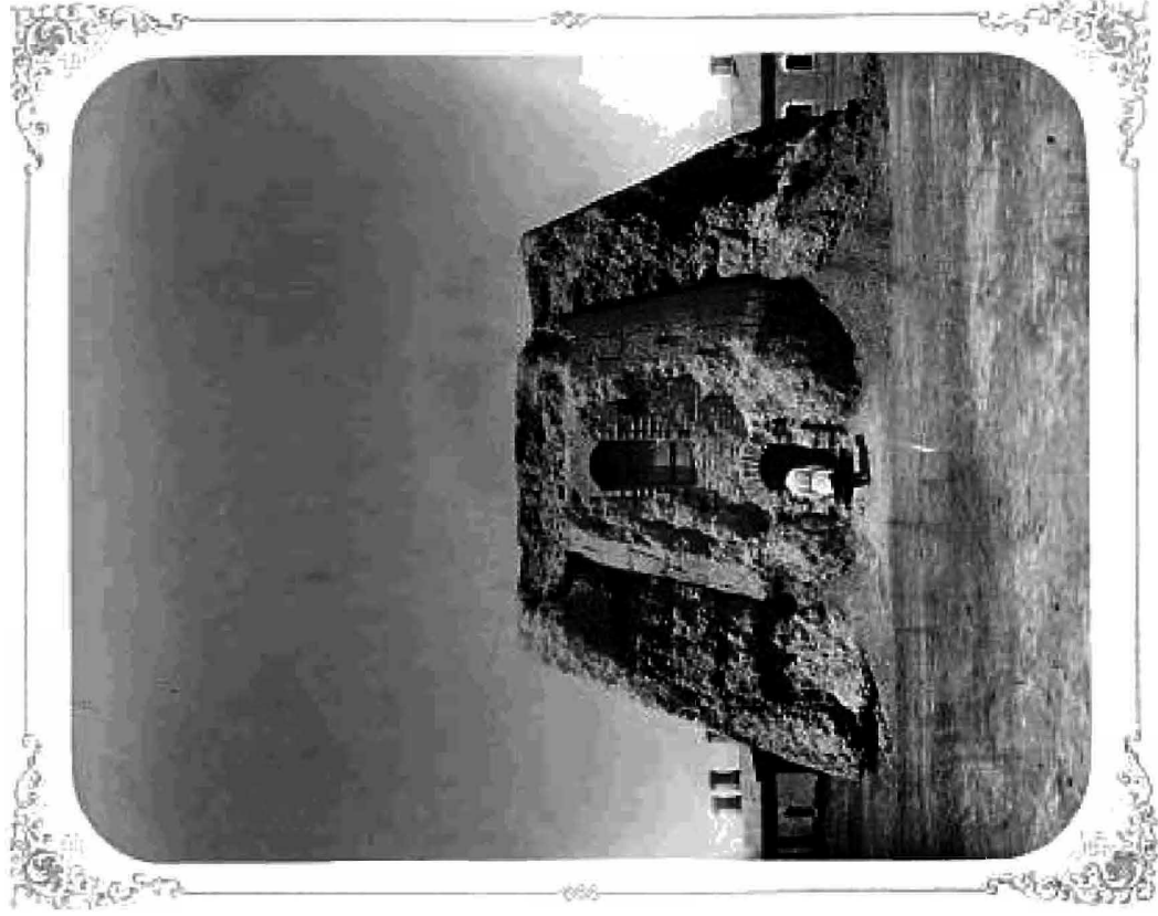
ОСТАТКИ БЫВШЕЙ КОКАНСКОЙ КРЕПОСТИ ВНУТРИ ФОРТА ПЕРОВСКОГО.