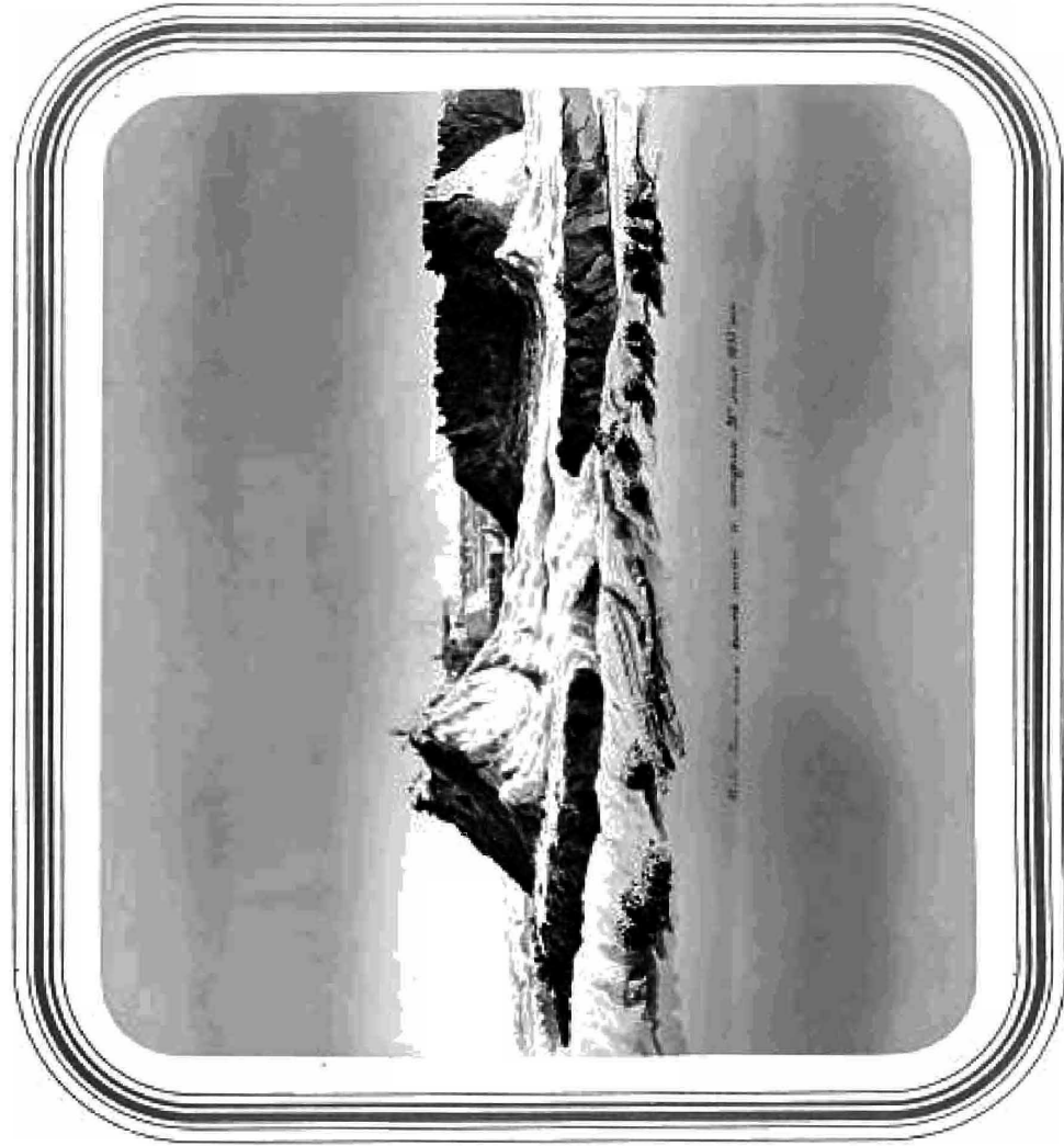
ВИДЪ КОКАНСКОЙ КРАЙНОСТИ АКЪ-БЕЧЕТТИ ПОСЛѢ ШТЪРМА 28 ЮЛЯ 1853.