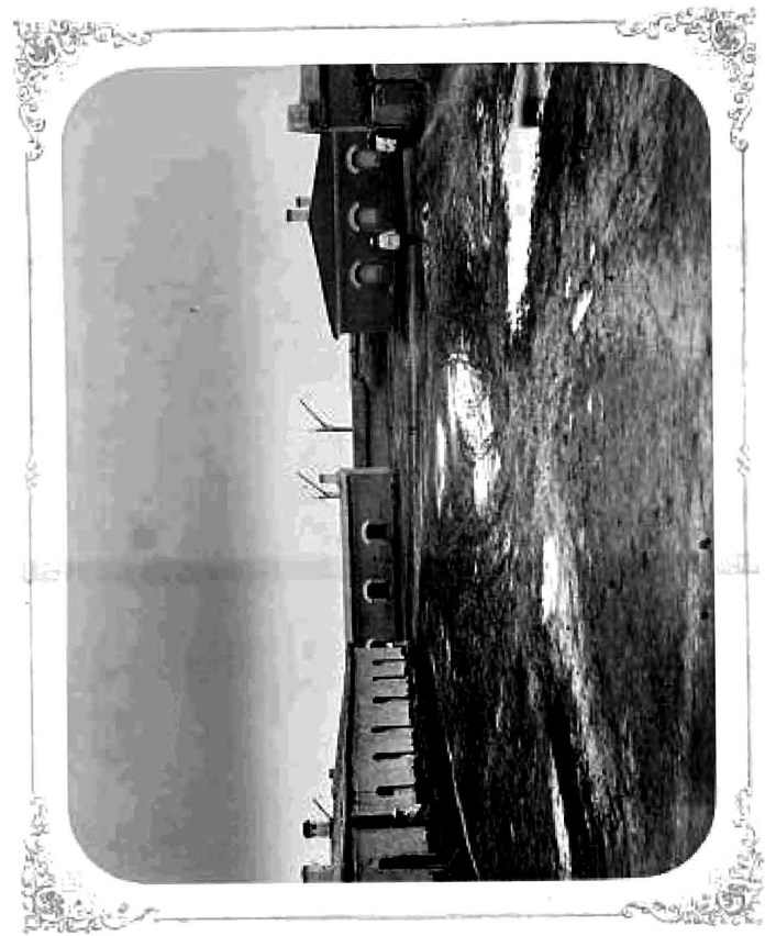
ПОСТРОЙКИ ВЪ УКРЕПЛЕНИИ ФОРТЪ №1.