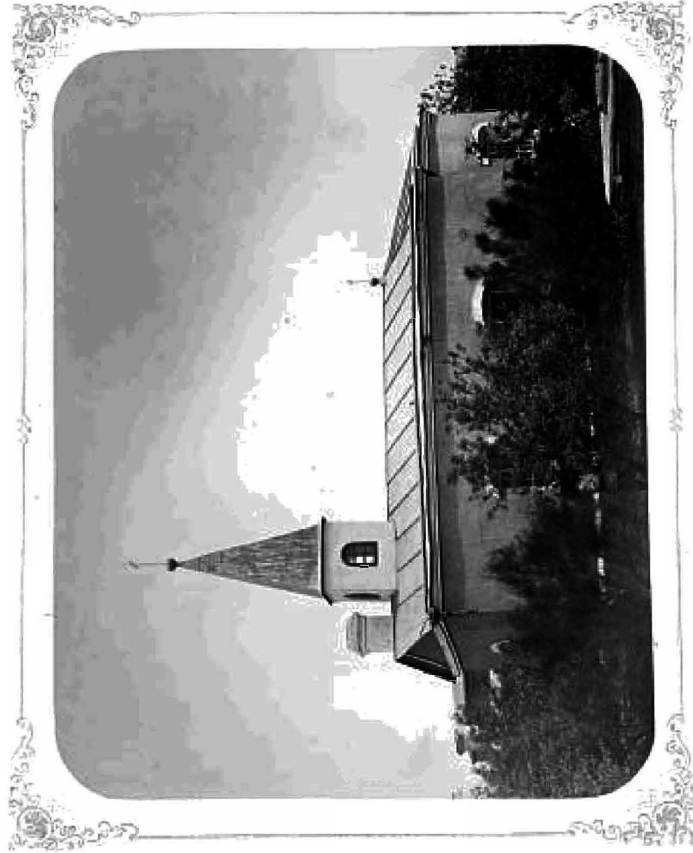
ВЪ П. ДРГО. № 2.