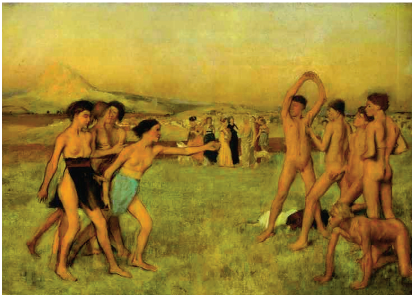
«Юные спартанцы», 1860, холст, масло. Лондонская Национальная галерея, Лондон

короткой встречи с Энгром старый мастер посоветовал: «Рисуйте линии, молодой человек, множество линий, и вы станете хорошим художником». Когда в 1856 году Дега отправился в Неаполь, он, несмотря на свой юный возраст, был уже основательно подготовлен. Это было традиционное посещение Италии, которое предпринимали почти все французские художники.