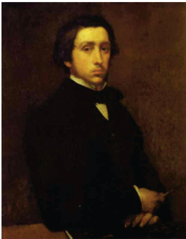
«Автопортрет», 1855, холст, масло. Музей д'Орсэ, Париж

Замечательные картины, рисунки Дега, высочайшее мастерство, достигнутое им в передаче движения, — все это обеспечивает его принадлежность к плеяде великих художников, оказавших наибольшее влияние на дальнейшее развитие мировой живописи. Во всех его работах, столь разных по настроению и содержанию, есть некие общие приметы, и самая важная из них — его извечное увлечение состоянием равновесия. Танцовщица это или жокей на коне, циркач или просто натурщик, Дега, вписывая фигуры в окружающее пространство, всегда стремился достичь равновесия. Интерес к вопросам притяжения человека к земле является отличительной чертой его произведений.