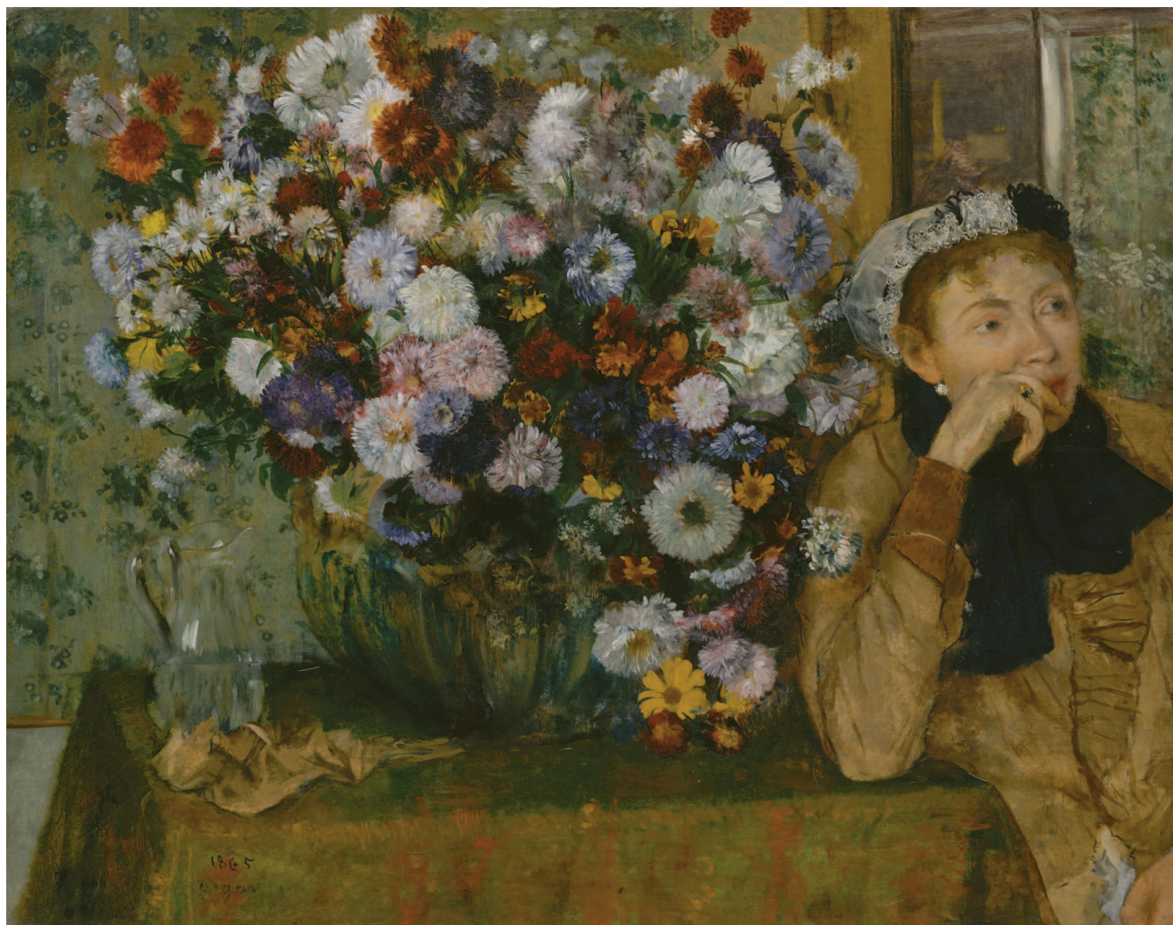
«Женщина, сидящая у вазы с цветами», 1865, холст, масло. Метрополитен-музей, Нью-Йорк

своих друзей Моро и Мане. Некоторые его произведения экспонировались в Салоне в 1865—1870 годах, но критики часто даже не удостоивали их упоминанием. Впрочем, Дега находился в привилегированном положении — его семья была состоятельной и в деньгах художник не нуждался.