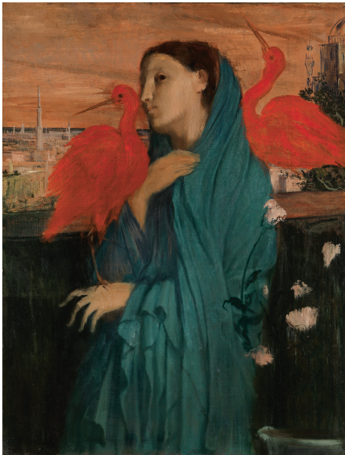
«Девушка с ибисами», 1862, холст, масло. Метрополитен-музей, Нью-Йорк