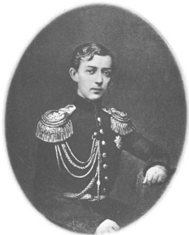
ЕГО ИМПЕРАТОРСКОЕ ВМСОЧЕСТВО ГОСУДАРЬ ЦЕСАРЕВИЧЪ НИКОЛАЙ АЛЕКСАНДРОВИЧЪ †.