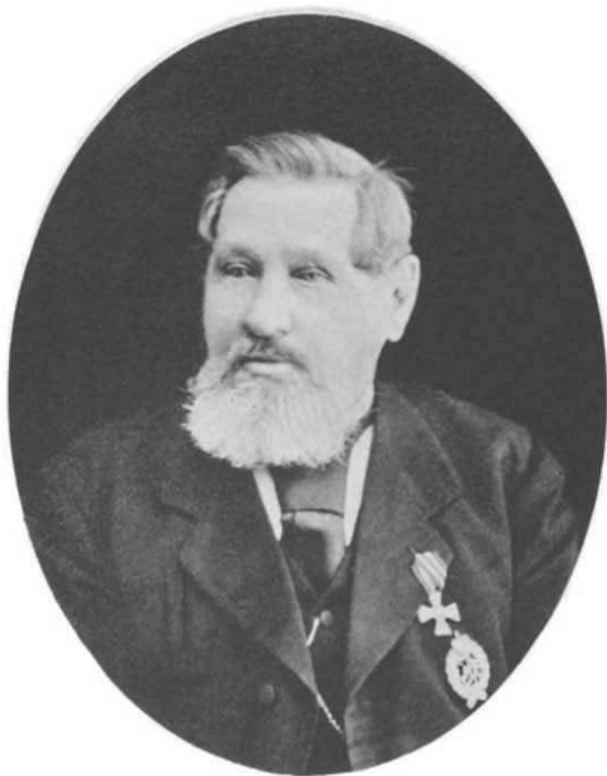
ГЕНЕРАЛЬ-МАЮРЪ АЛЕКСАНДРЪ БОРДАНОВИЧЪ ДИХЕУСЪ. 1822.