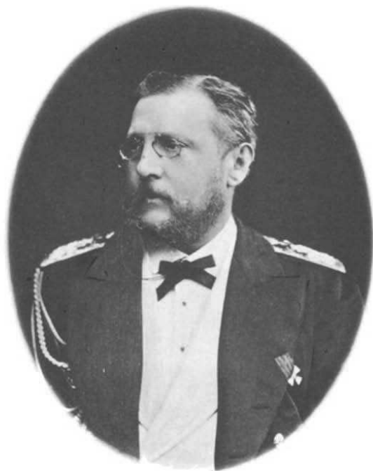
ЕГО ИМПЕРАТОРСКОЕ ВЫСОЧЕСТВО ГОСУДАРЬ ВЕЛИКІЙ КНЯЗЬ КОНСТАНТИНЪ НИКОЛАЕВИЧЪ.