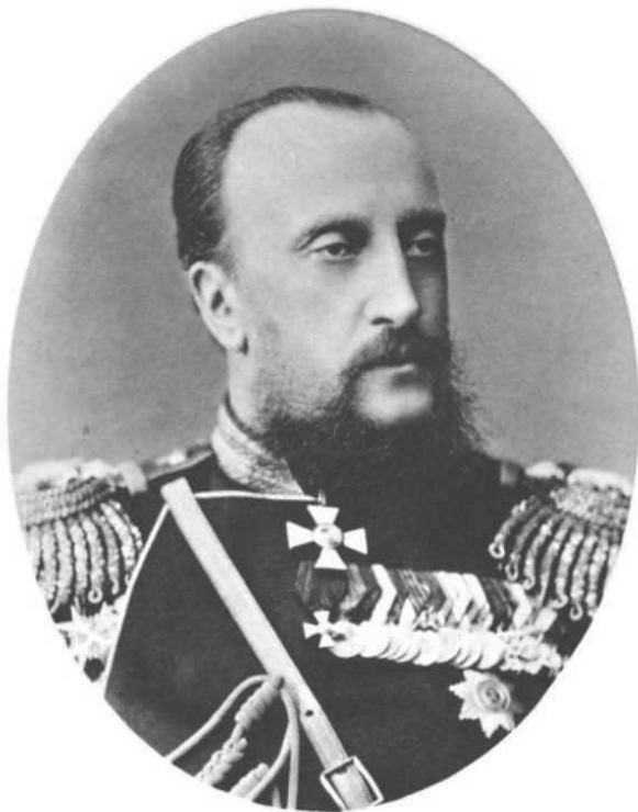
ЕГО ИМПЕРАТОРСКОЕ ВЫСОЧЕСТВО ГОСУДАРЬ ВЕЛИКИЙ КНЯЗЬ НИКОЛАЙ НИКОЛАЕВИЧЪ, СТАРШИЙ.