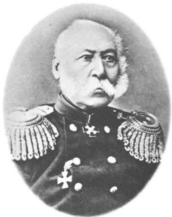
ГЕНЕРАЛЪ-МАЮРЪ ИВАНЪ ПАВЛОВИЧЪ МАРКОЗОВЪ. 1819.