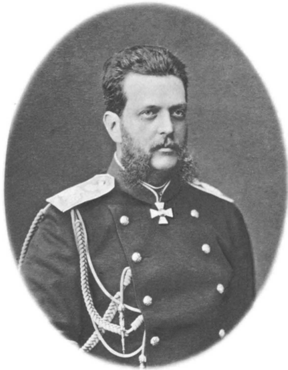
ЕГО ИМПЕРАТОРСКОЕ ВЪСОЧЕСТВО ГОСУДАРЬ ВЕЛИКІЙ КНЯЗЬ ВЛАДИМІРЪ АЛЕКСАНДРОВИЧЪ.