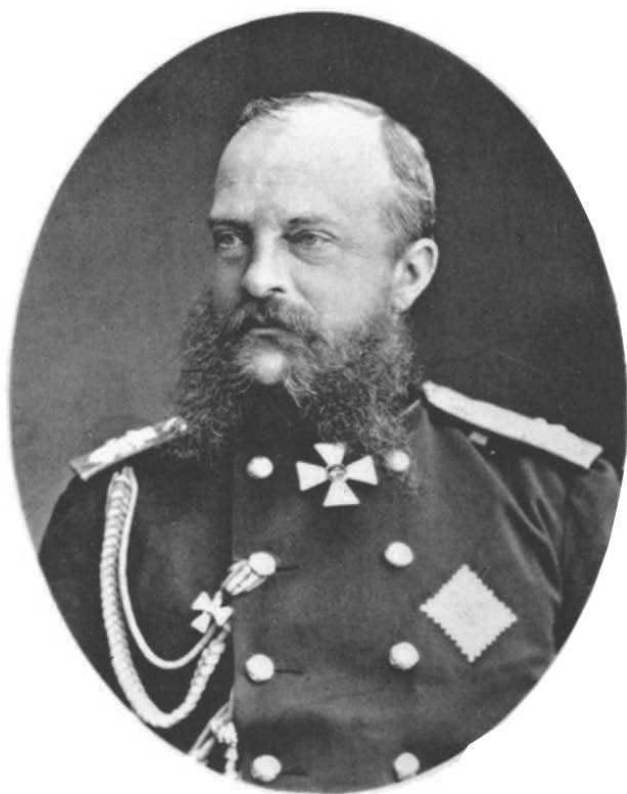
ЕГО ИМПЕРАТОРСКОЕ ВМСОЧЕСТВО ГОСУДАРЬ ВЕЛИКІЙ КНЯЗЬ МИХАИЛЬ НИКОЛАЕВИЧЪ.