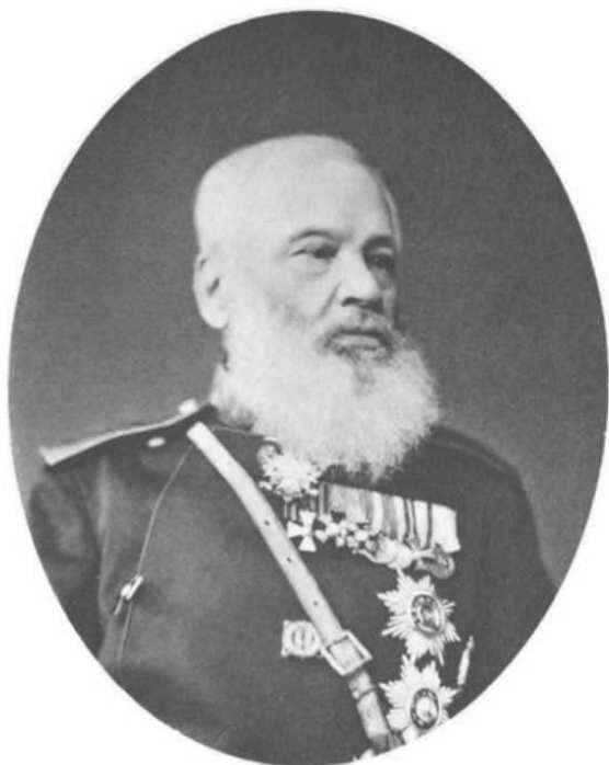
ГЕНЕРАЛЪ ОТЪ ИНФАНТЕРИИ АЛЕКСѢЙ АЛЕКСѢЕВИЧЪ ОДИНЦОВЪ. 1822