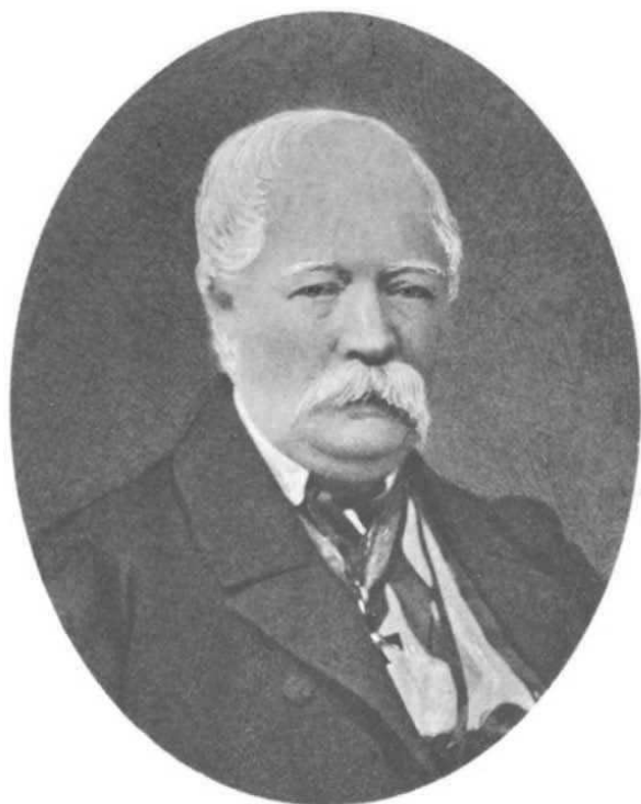
ГЕНЕРАЛЪ-МАЮРЪ ВЛАДИМІРЪ ПЕТРОВИЧЪ ЖУКОВСКІЙ. 1797.