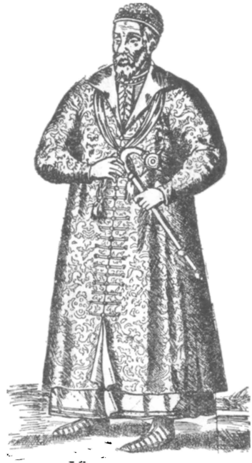
Одежда знатного москвитя.

Под угрозой нового восстания московское правительство делает ряд уступок. Непосредственным следствием восстания был созыв земского собора, составившего Уложение 1649 года. Выдачами жалованья задобриваются стрельцы и другие ратные люди. Князь Черкасский играет роль народного любимца и в сентябре 1648 г. угощает водкой стрельцов в своем доме. Временные уступки оказались крайне ненадежными. В октябре в Москву возвращается Морозов, а в конце того же месяца Черкасскому «с двора в город съезжать не велено». В Москве производятся многочисленные аресты среди стрельцов и посадских людей. Участников восстания 1648 г. сажают под арест и высылают из Москвы под разными предлогами, обвиняя в продаже табака или водки, игре в карты и в кости. В январе 1649 г. идут слухи о новом заговоре против Морозова. Множество людей гибнет на пытках при допросах. На площадях про-