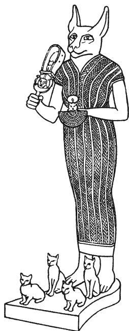
Баст с систром и священными кошками. Британский музей

Бубастис располагался к востоку от дельты Нила, недалеко от его притока Пелусиака, в этом месте все еще стоит высокая насыпь, называемая Тел-Баста. Она упоминается в Книге пророка Иезекииля как Пай-Бисет (читай Пу-Бастум), и, вероятно, считалась тогда важным городом. Про-