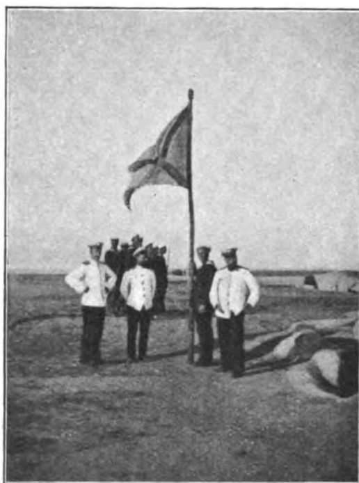
Подъемъ Русскаго Андреевскаго флага въ Шанхайгуанъ въ 1900 г.

Иль Русскій отъ побѣдъ отвыкъ? Иль мало насъ? Или отъ Мерми до Фавриды, Отъ Финскихъ хладныхъ скалъ до пламенной Колхиды, Отъ потрясеннаго Кремля До стѣнъ недвижнаго Китая, Стальной щетиною свергая, Не встанетъ Русская земля?