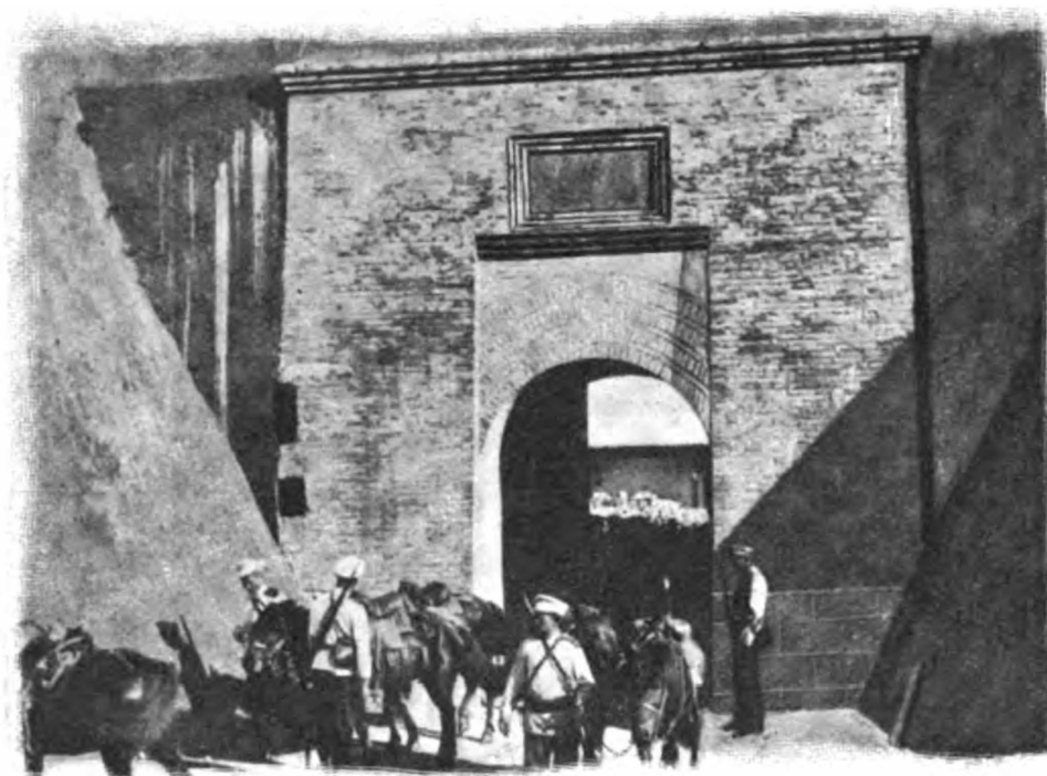
Наши казаки у Великой Китайской стѣны.