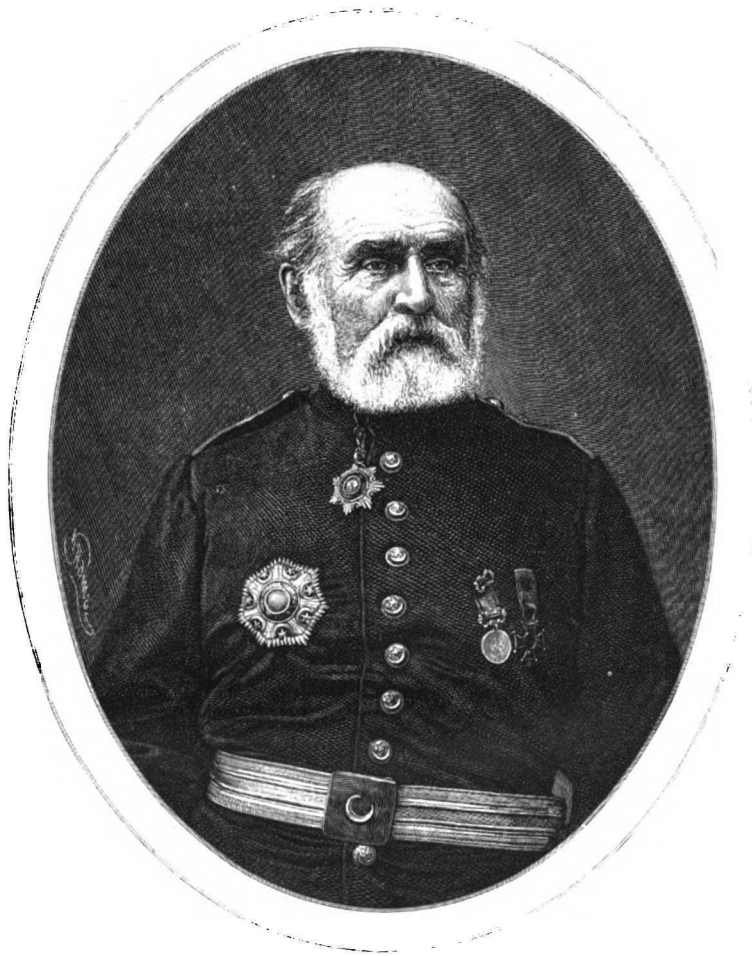
М. ЧАЙКОВСКІЙ. МЕХМЕДЪ-САДЫКЪ-ПАША (ВЪ СТАРОСТИ).