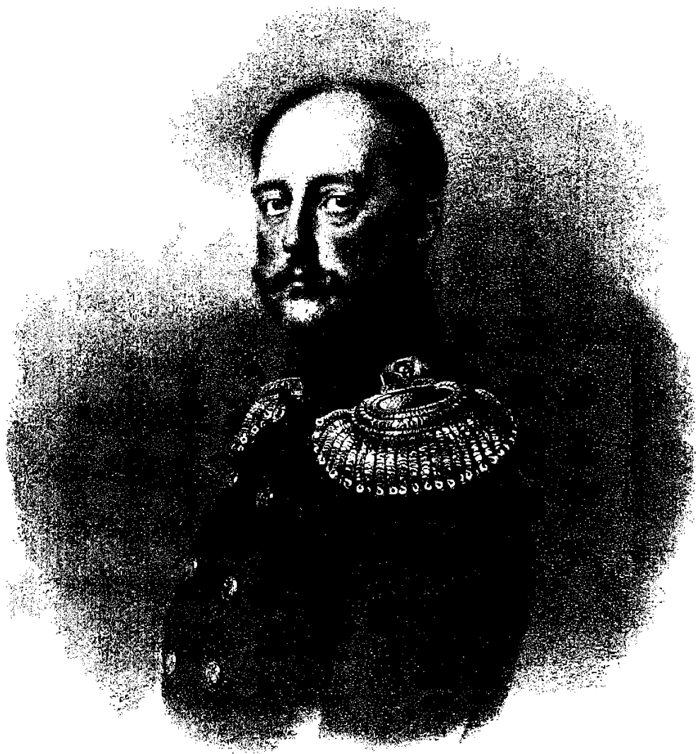
ИМПЕРАТОРЪ НИКОЛАЙ I.