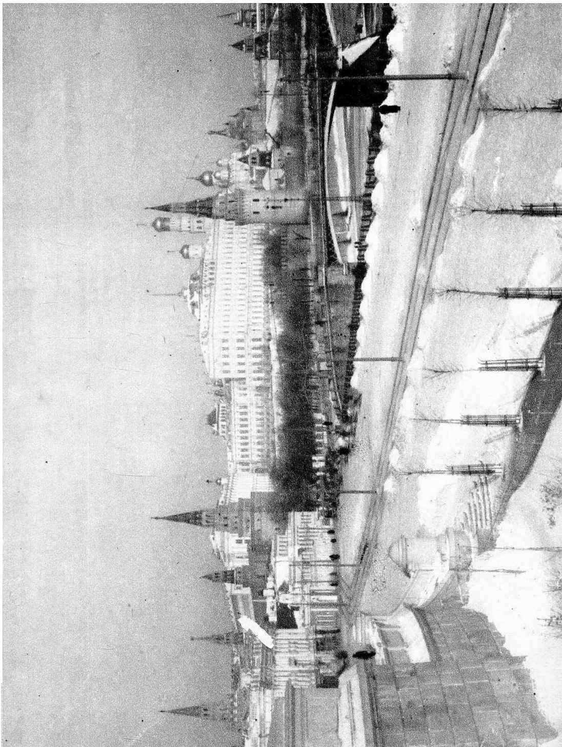
Фото-тинто-гравюра Г-ва «Обр

Общій видъ Кремля отъ Храма Христа Спасителя.