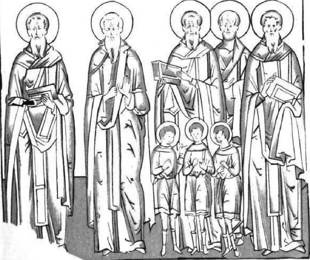
Авторграфъ при Музеѣ въ нѣ Анснїцкой