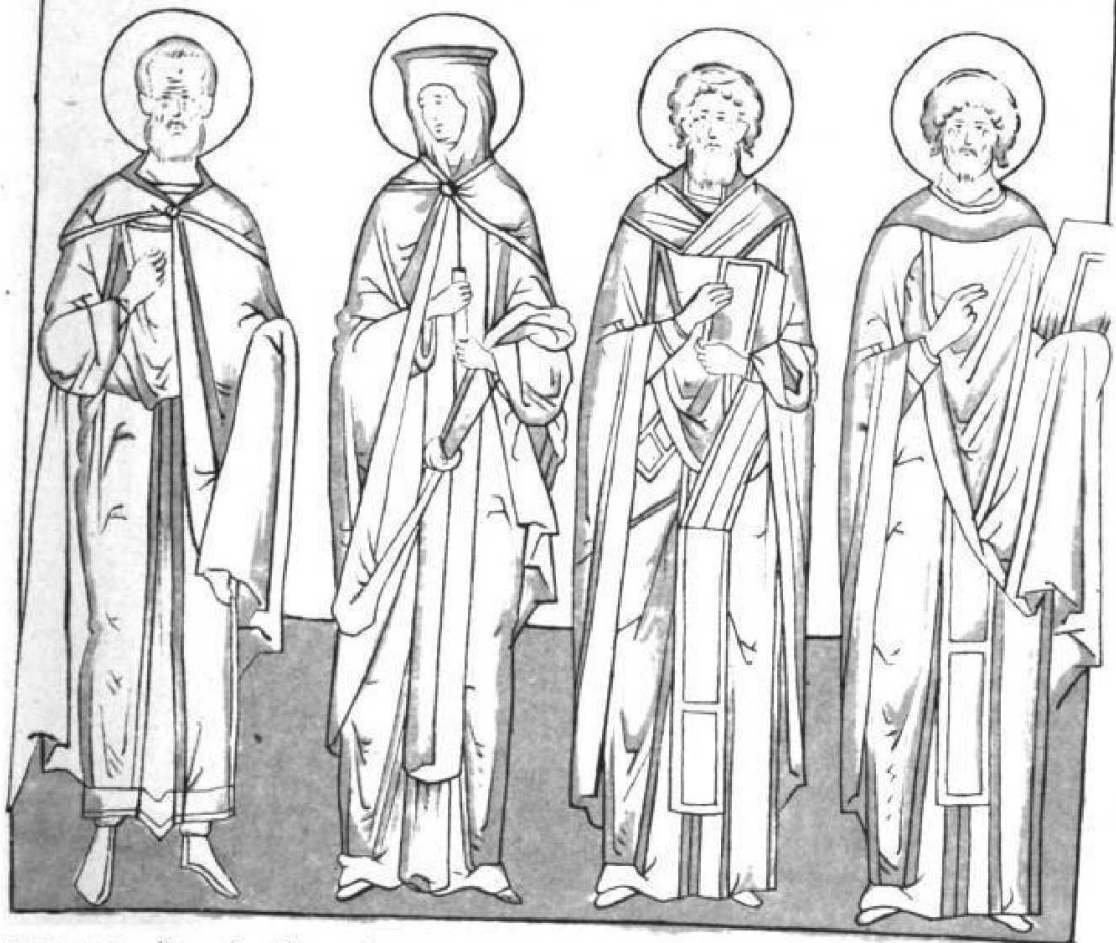
Историч. фон. МелуеѦна. МаслицѦ.