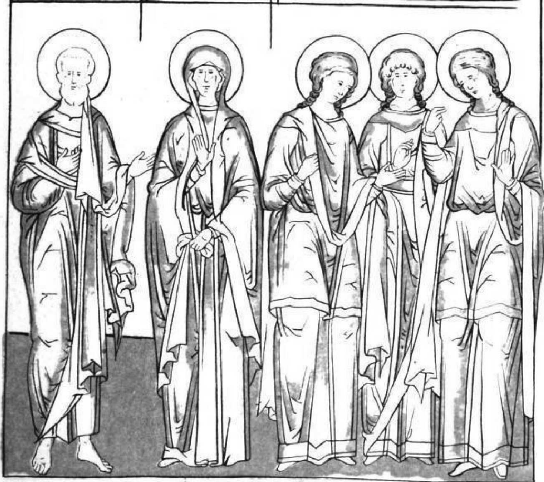
Литограф при Музеевѣ на Ямницкой