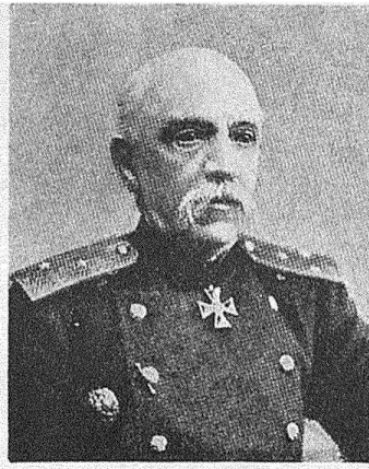
Генераль отъ артиллеріи П. А. Крыжановскій. (Т. XIV, стр. 325).