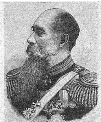
Генераль отъ кавалеріи А. П. Кулгачевъ. XIV, стр. 383).