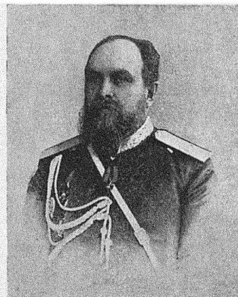
Генераль-лейтенантъ П. С. Кублицкій. (Т. XIV, стр. 368).