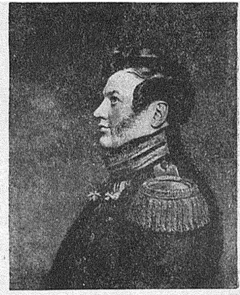
Генераль-лейтенантъ М. К. Крыжановскій. (Т. XIV, стр. 324).