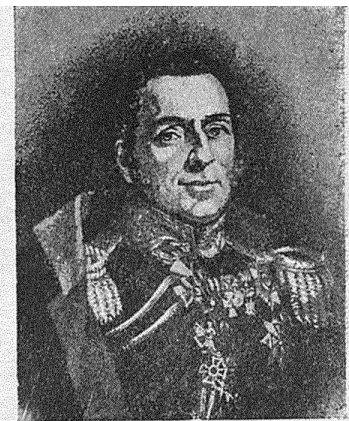
Генераль отъ инфантеріи гр. Д. Д. Курута. (Т. XIV, стр. 424).