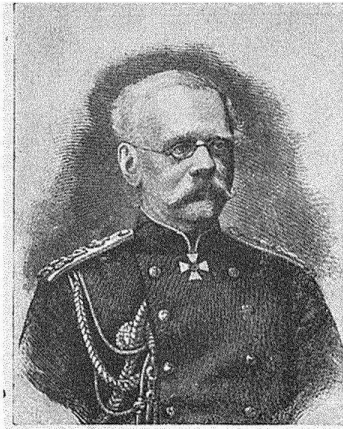
Генераль-адъютантъ Н. А. Крыжановскій. (Т. XIV, стр. 325).