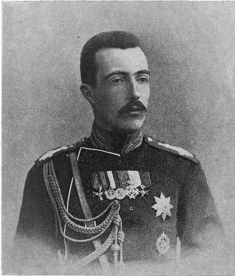
Его Императорское Высочество Великій Князь МИХАИЛЬ МИХАИЛОВИЧЪ. Августѣйшій Шефъ 49-го пѣхотнаго Брестскаго полка (съ 26 августа 1912г.) (Т. V, стр. 66).