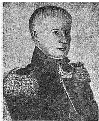
Генераль отъ инфантеріи И. П. Кульневъ. (Т. XIV, стр. 389).