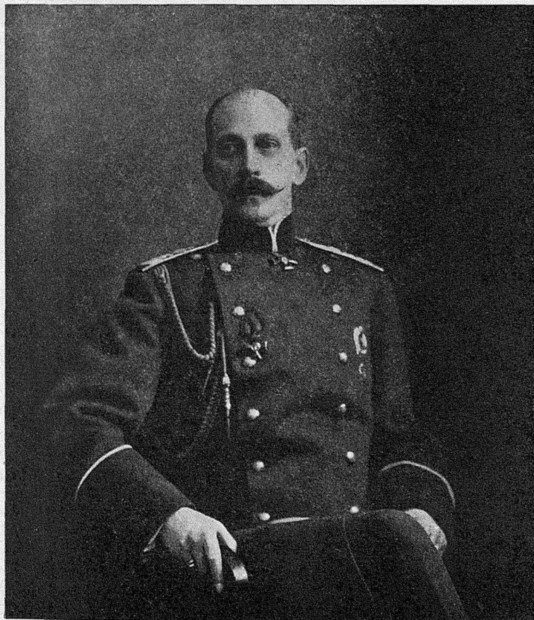
Его Императорское Высочество Великій Князь ПАВЕЛЬ АЛЕКСАНДРОВИЧЪ. Августѣйшій Шефъ 79-го пѣхотнаго Куринаскаго полка. (Т. XIV, стр. 406).