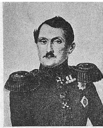
Генераль отъ инфантеріи П. Я. Купріяновъ. (Т. XIV, стр. 400).