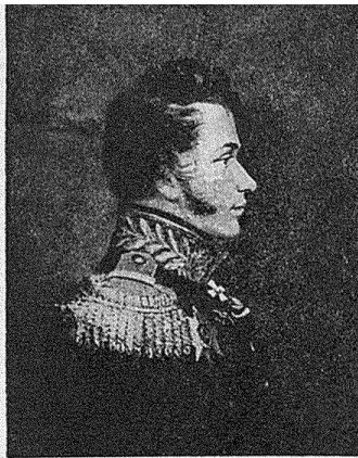
Генераль-маіоръ кн. Н. Д. Кудашевъ. (Т. XIV, стр. 369).