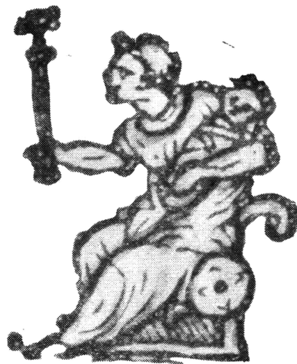
1. ЗОЛОТАЯ БАБА (увеличение с рисунка на карте Герберштейна 1551 г.).

В таежном глухом лесу остяка подстерегали многие опасности, а он был почти беспомощен. «...Бесилие дикаря в борьбе с природой порождает