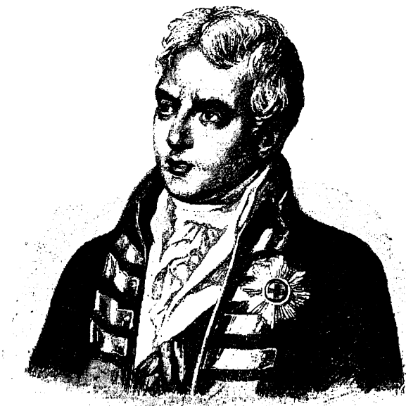
Лордъ Кэстльри. (Совр. грав.).

Съѣздъ государей и министровъ въ Вѣну начался съ половины сентября. Никогда еще ни раньше, ни позже Европа не видѣла такого блестящаго собранія, какое представлялъ собою Вѣнскій конгрессъ. На немъ присутствовали императоры русскій и австрійскій, короли прусскій, датскій, баварскій и вюртембергскій и большая часть мелкихъ германскихъ государей. Каждое государство, какъ бы ни было оно незначительно, считало долгомъ послать въ Вѣну своихъ представителей, и въ совокупности число пріѣхавшихъ дипломатическихъ миссій доходило до 216. Австрію представляли Меттернихъ и Генцъ, Англію—Кэстльри (замѣщенный позже