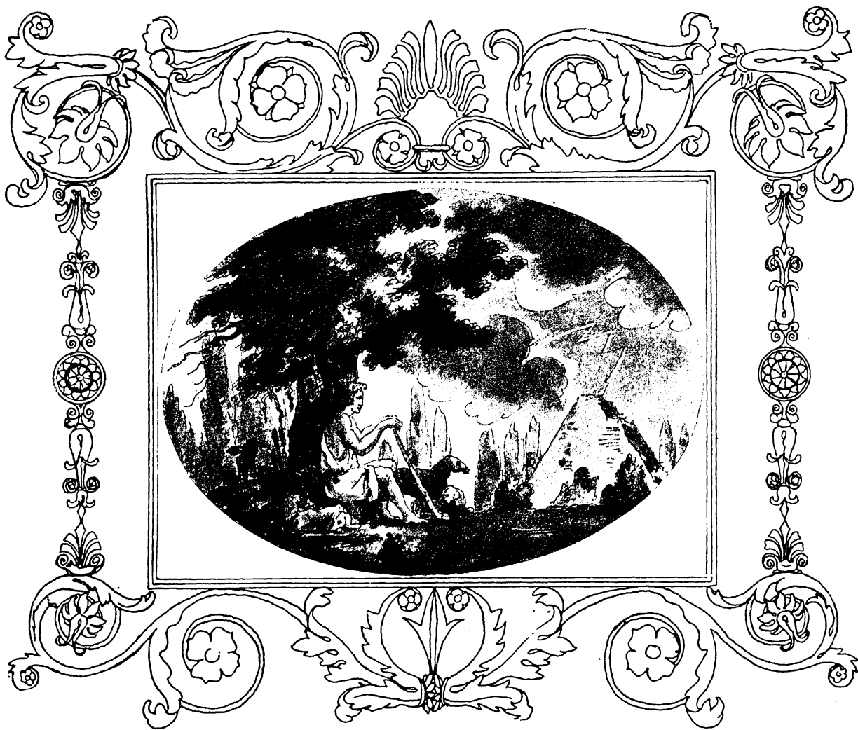
„Гордыхъ поражаетъ, а смиренныхъ осѣняетъ“.