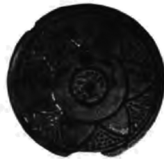
Рис. 4 (п. в.).

12) Слегка выпуклая шишечка отъ блюда изъ кости съ четырехугольными каналами, которые проходятъ черезъ шишечку, пересѣкаясь между собою. Верхняя часть ея была покрыта орнаментомъ въ видѣ звѣздчатой фигуры, сдѣланымъ черною краскою, которал уже стерлась. Диаметръ вверху 3,7 см., высота 1,3 см. (рис. 4).