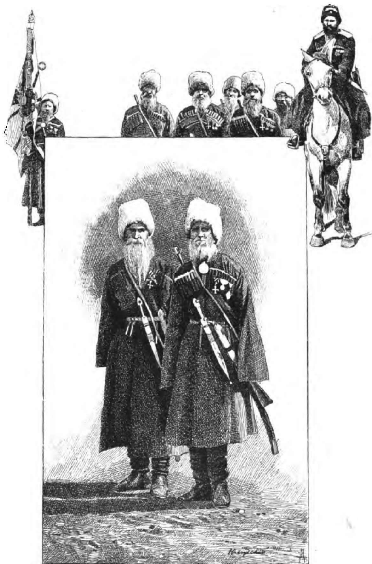
Казаци-ветераны. Рисоваль Н. Юмудскій.