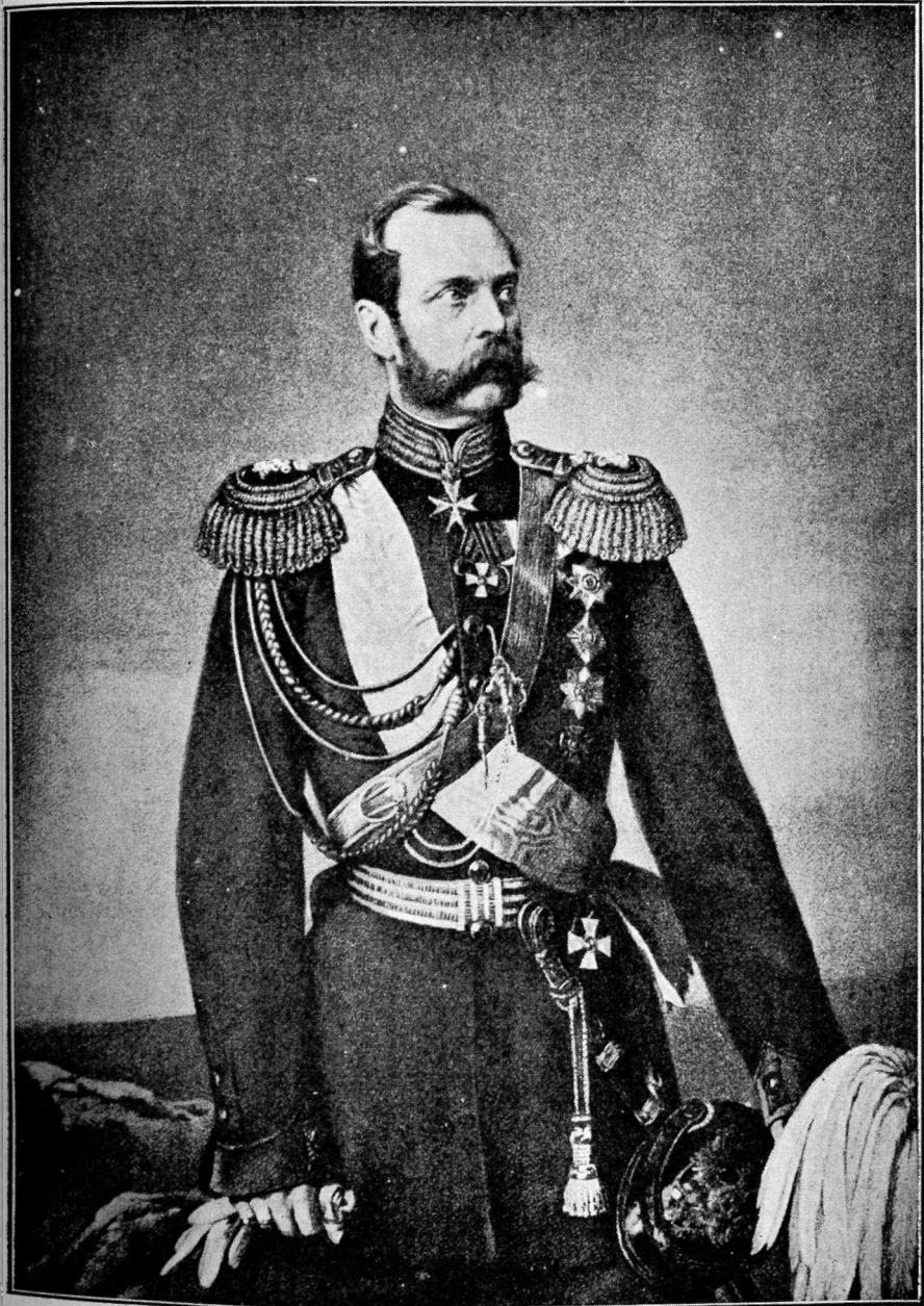
Императоръ Александръ II.