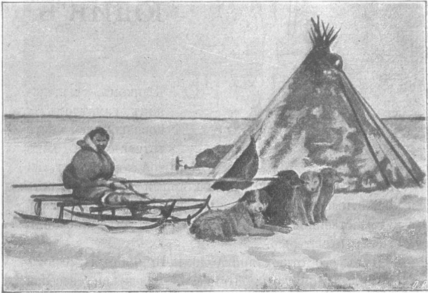
Чумъ самоѣда Вылки.

можно ли сегодня отправиться куда на охоту или въ экскурсію; новости, хотя ихъ было мало, все-таки были новостями, потому что другихъ и не было на этомъ островѣ, который только два раза въ годъ сообщался со всѣмъ остальнымъ свѣтомъ.