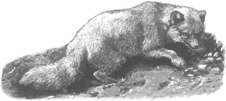
Песець или полярная лисица.

Онъ былъ уже не ребенокъ: ему, какъ говорила его мать, шелъ уже пятнадцатый годъ; но ни физически, по развитію, ни чѣмъ другимъ онъ еще не отличался отъ маленькаго мальчика, и блѣдный, съ слабымъ сложеніемъ, онъ скорѣе производилъ впечатлѣніе ребенка, словно эта полярная страна, гдѣ онъ родился, навсегда хотѣла его оставить такимъ хилымъ