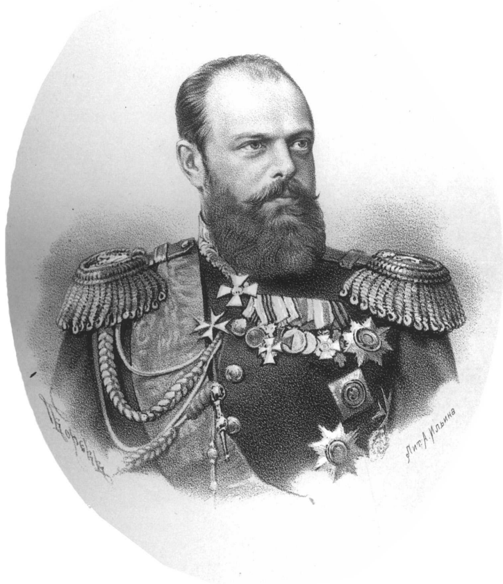
Е. И. В. ГОСУДАРЬ ИМПЕРАТОРЪ АЛЕКСАНДРЪ АЛЕКСАНДРОВИЧЪ.