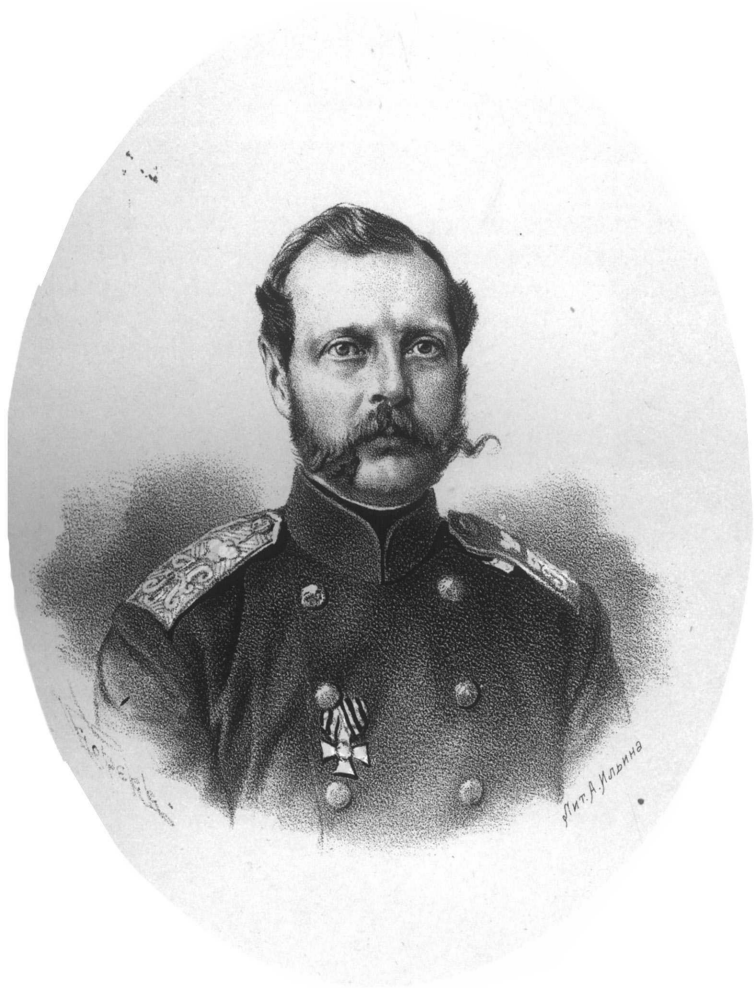
ИМПЕРАТОРЪ АЛЕКСАНДРЪ II.