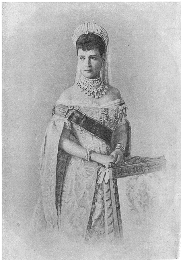
ЕЯ ИМПЕРАТОРСКОЕ ВЕЛИЧЕСТВО ГОСУДАРЫНЯ ИМПЕРАТРИЦА МАРІЯ ФЕОДОРОВНА.