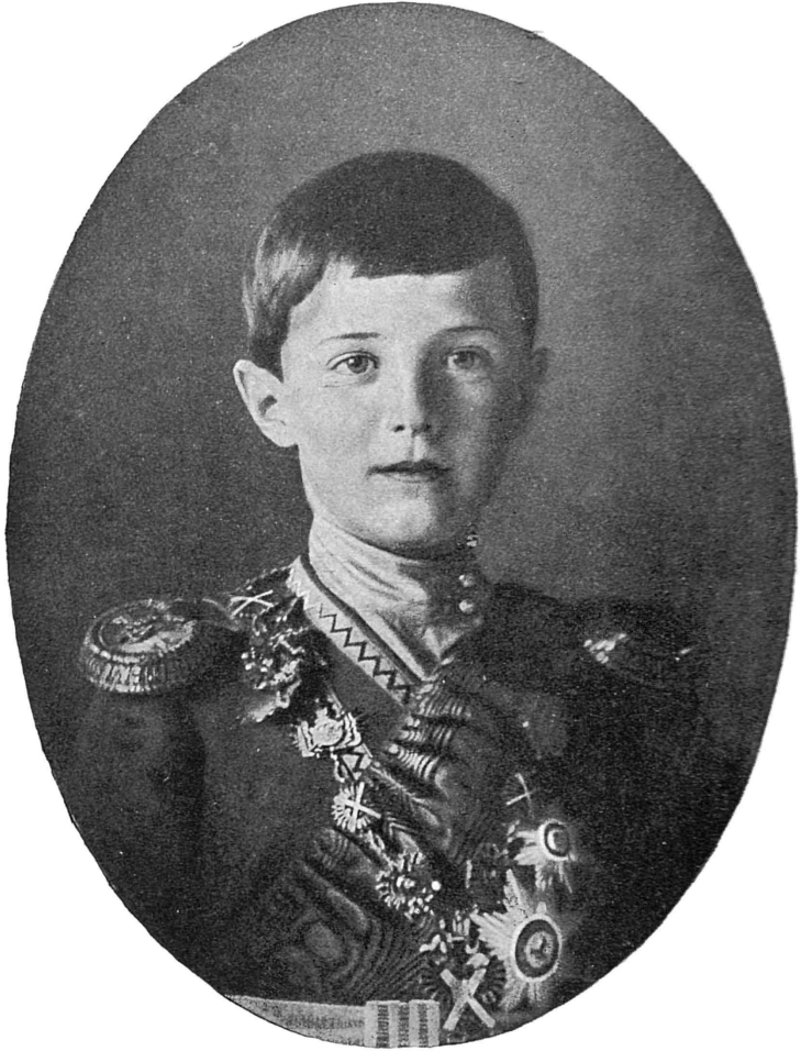
ЕГО ИМПЕРАТОРСКОЕ ВЫСОЧЕСТВО НАСЛѢДНИКЪ ЦЕСАРЕВИЧЪ и ВЕЛИКІЙ КНЯЗЬ АЛЕКСѢЙ НИКОЛАЕВИЧЪ.