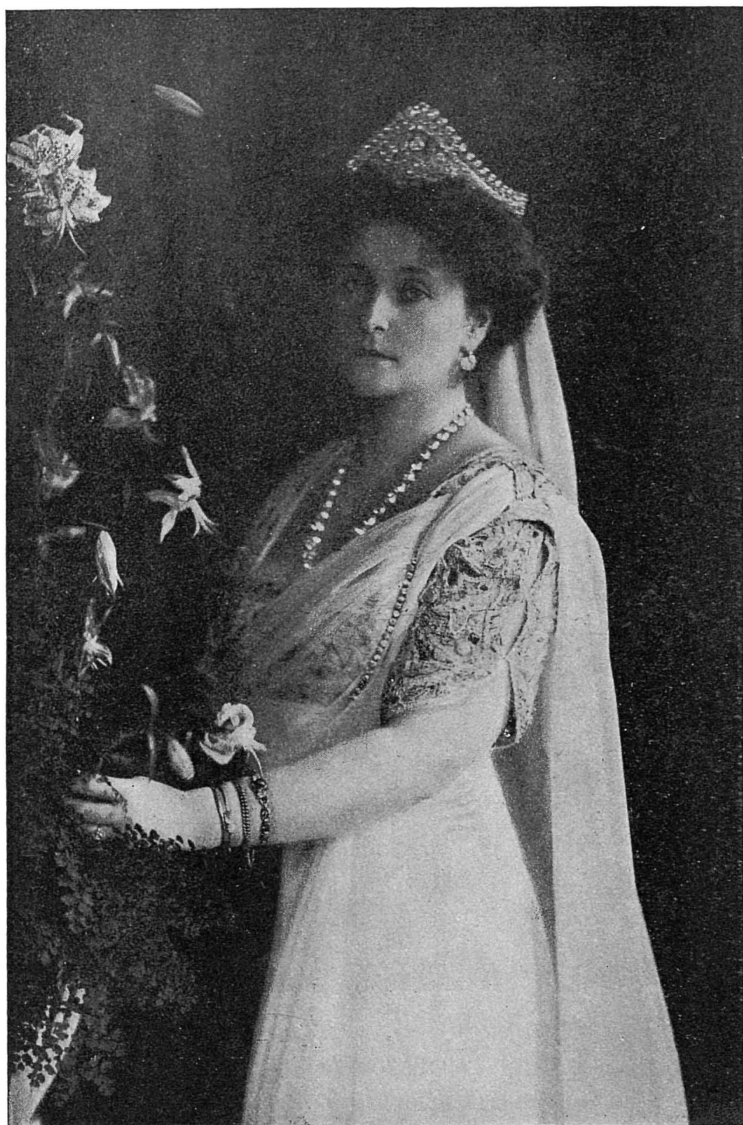
ЕЯ ИМПЕРАТОРСКОЕ ВЕЛИЧЕСТВО ГОСУДАРЫНЯ ИМПЕРАТРИЦА АЛЕКСАНДРА ФЕОДОРОВНА.