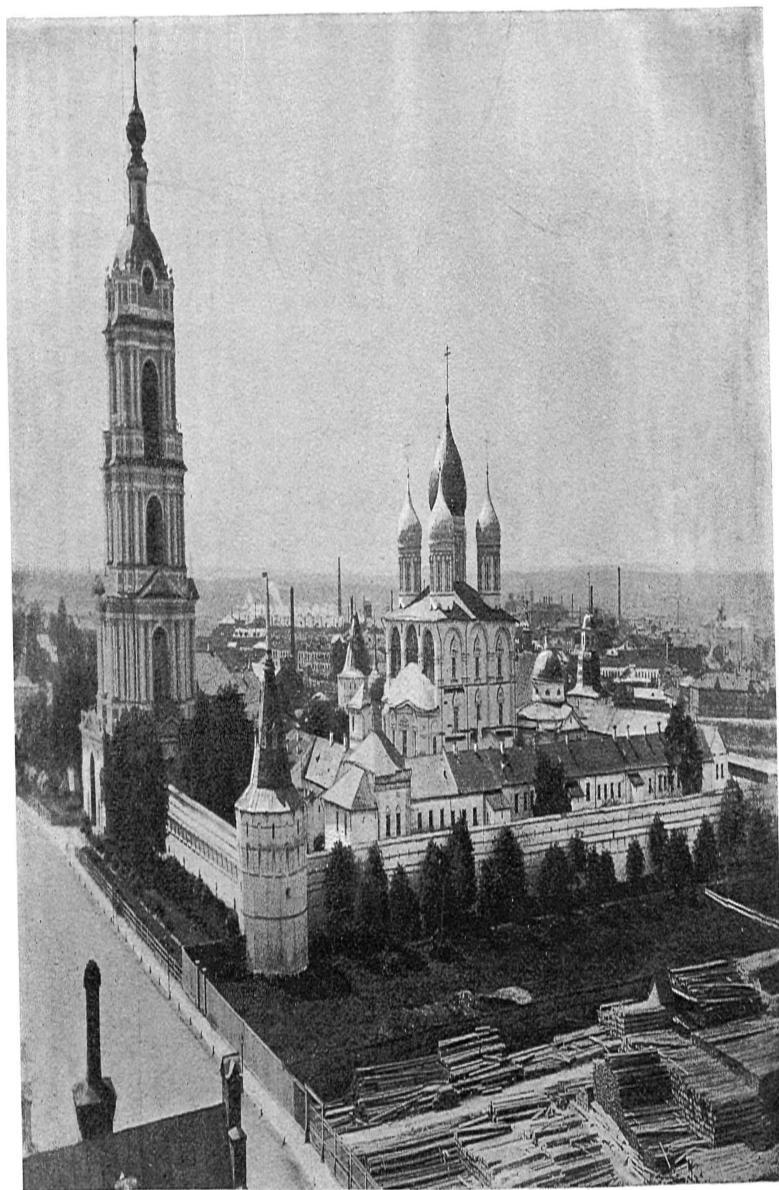
Новоспасский монастырь въ Москвѣ—усыпальница предковъ Дома Романовыхъ.