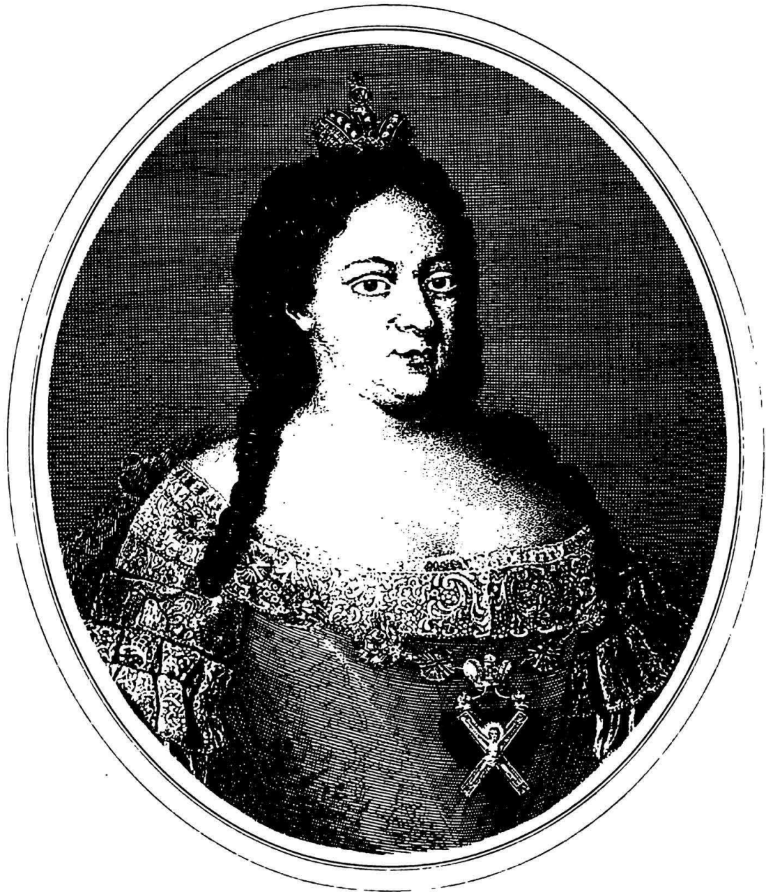
ИМПЕРАТРИЦА АННА ИОАННОВНА.