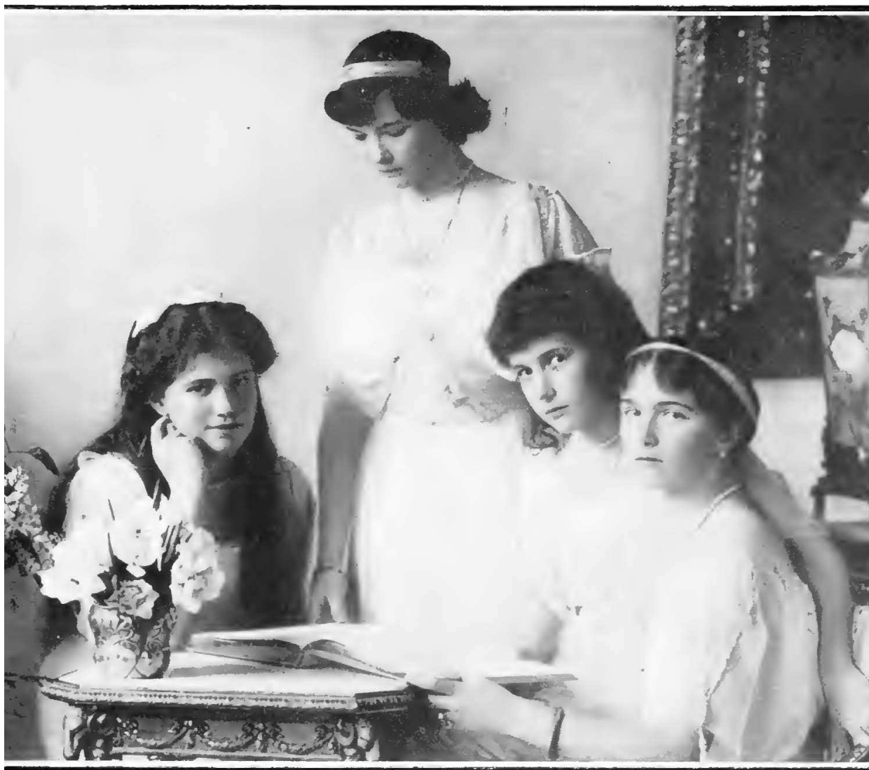
Ихъ Императорскія Высочества Великія Княжны. Ольга, Татьяна, Марія и Анастасія Николаевны.