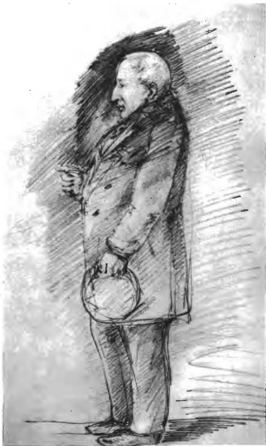
И. М. Снѣгиревъ.