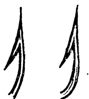
Рис. 204. Жало английских крючков.

Последние крючки гораздо лучше крючков Кирби, которые имеют следующие недостатки: 1) в них ширина сгиба слишком велика; 2) острие слишком сильно направлено наружу и слишком повернуто в сторону. Все эти недостатки способствуют неверности подсечки и соскакиванию рыбы с крючка. Еще хуже Кирби — продаваемые