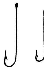
Рис. 207. Мотыльные крючки.

в магазинах крючки с колечками; они обыкновенно бывают низкого достоинства. Исключение составляют т. н. мотыльные крючки с длинными тонкими стержнями (употребляемые б. ч. для ершей на мотыля), которые также хорошо закалены и имеют такое же острое и длинное жало, как крючки Кирби и Лимерик.