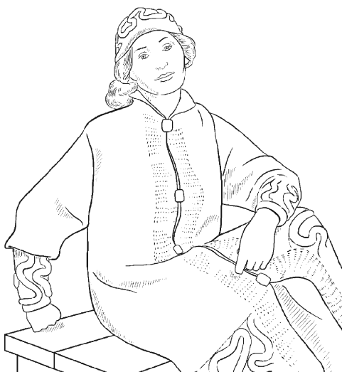
Рис.1. Пальто с оригинальной отделкой

Мягкое вязаное теплое пальто во многом удобнее привычного драпового. Тем более его не так сложно связать своими руками. Общий вид изделия представлен на рисунке 1.