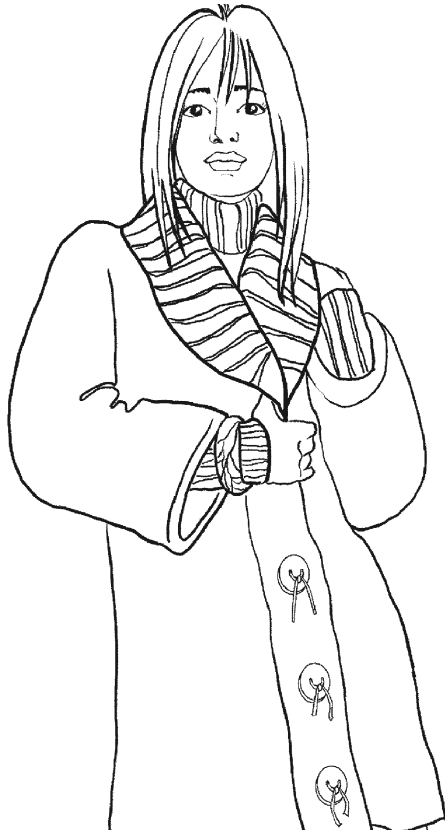
Рис. 3. Женское полупальто

Полочки. Петли для полочек (без планок для застежки) набрать из кромочной петли кокетки переда. Полочки связать той же длины, что и спинка.