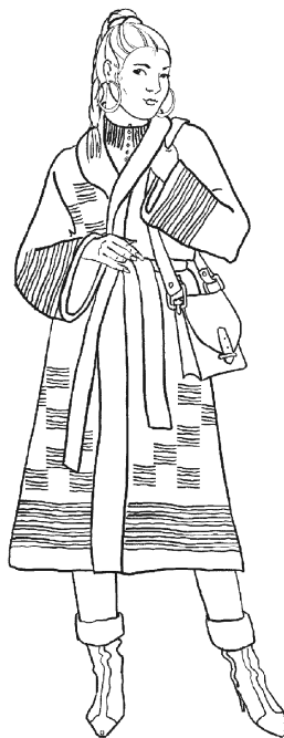
Рис. 5. Женское двухцветное пальто

Платочная вязка в полоску: чередовать каждые 2 ряда черную и красную нити.