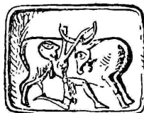
Тренировочные игры с быком (изображения на печатях и резных камнях)

Иной характер начали принимать эти действия в конце позднеминойского и позднемикенского периодов, когда резко усилился процесс отделения и возвышения экономически-мощных аристократических родов; так появилась родовая аристократия. Особенно ярко это изменение характера празднеств сказалось в организации игр с быком. Лучшие быки-производители и лучшие стада скота оказались в руках экономически возвысившихся родов, которые теперь и сделались основными организаторами и участниками прежде общеплеменных игр.