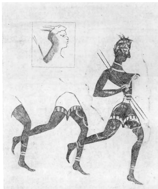
Тренировочный бег критских и негритянских юношей (фреска)

Изменение характера игр с быком, превращение их в спортивно-зрелищное действие, показывающее ловкость того или иного отдельного исполнителя, выдвинули необходи-