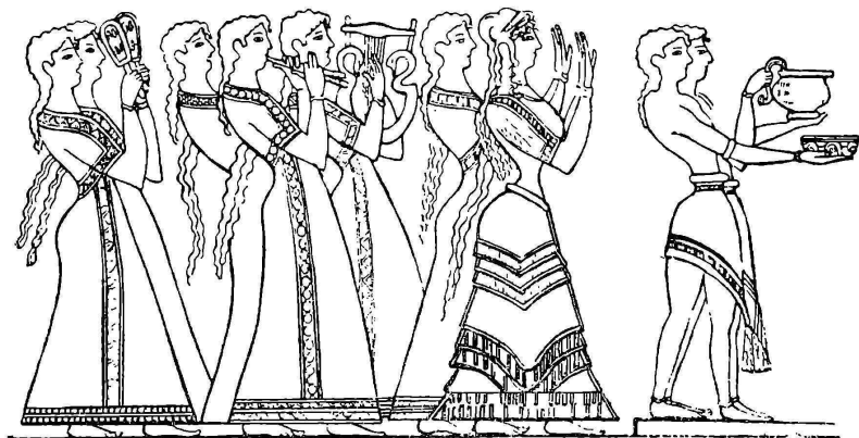
Процессия представителей родов (фреска в Кноссе)

Подобная же площадка, правда, значительно меньших размеров, была обнаружена при раскопках в 1901—1903 гг. в Кноссе. Она располагалась поблизости от так называемого Кносского дворца, причем, занимая территорию 10 на 13 м,