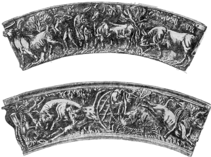
Сцены, относящиеся к играм с быком (на нубнах Вафио)

1. Культурная (театрализованная) церемония «брака» верховной жрицы с «Минотавром» (всждем племени, одетым в обрядовый костюм быка). Она заканчивалась, вероятно, магической пляской «Минотавра» под хоровое пение всех присутствовавших. Проводилась она на сценической площадке.