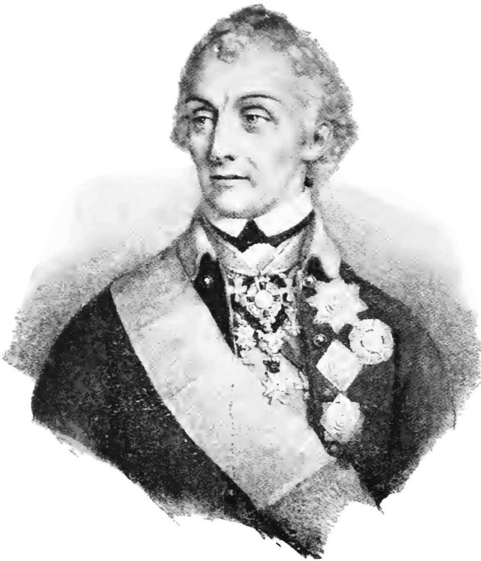
Генералиссимусъ Князь Италійскій Графъ Суворовъ Рымникскій.